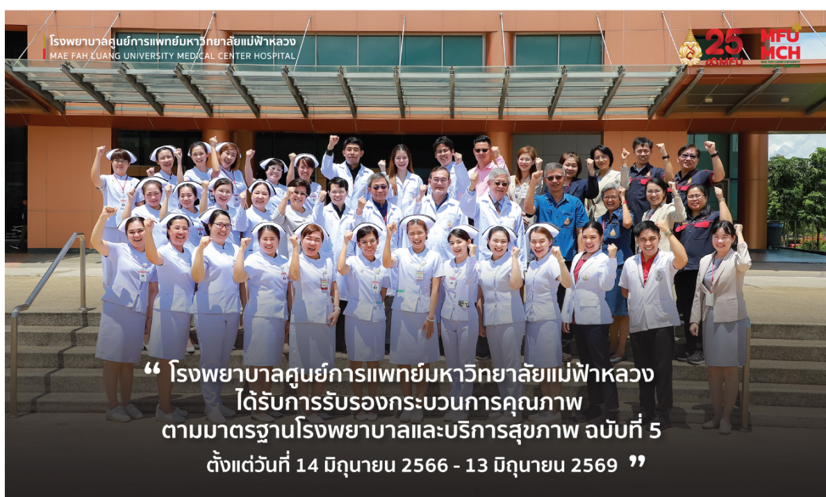
“ โรงพยาบาลศูนย์การแพทย์มหาวิทยาลัยแม่ฟ้าหลวง ได้รับการรับรองกระบวนการคุณภาพ ตามมาตรฐานโรงพยาบาลและบริการสุขภาพ ฉบับที่ 5 ตั้งแต่วันที่ 14 มิถุนายน 2566 - 13 มิถุนายน 2569 ”

23 มิถุนายน 2566 โรงพยาบาลศูนย์การแพทย์มหาวิทยาลัยแม่ฟ้าหลวง เป็นสถานพยาบาลที่ได้รับการรับรองกระบวนการคุณภาพตามมาตรฐานโรงพยาบาลและบริการสุขภาพ ฉบับที่ 5 โดยมีระยะเวลา 3 ปี ระหว่างวันที่ 14 มิถุนายน 2566 – 13 มิถุนายน 2569