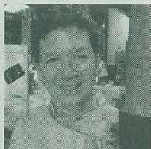
เดือนจิตเทศน์