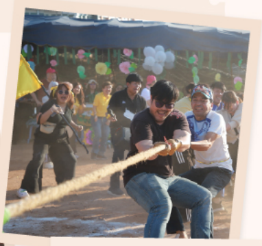
สีเหลือง