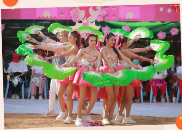
รางวัลชนะเลิศอันดับที่ 1 "สีฟ้าและเขียว"