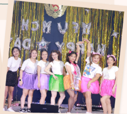
"IPD 9B ผู้สาวยุคใหม่ หัวใจมักม่วน"