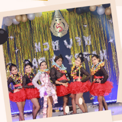
"ปานดารากั"