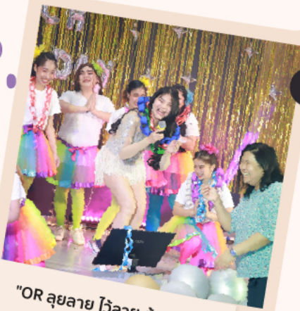
"OR ลุยลาย ไวลาย สู้ตาย สู้สู้"