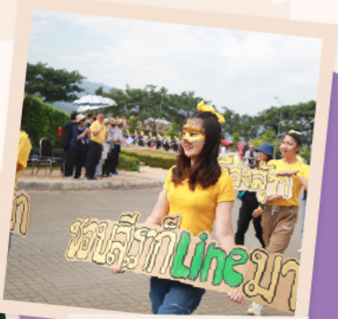
สีเหลือง