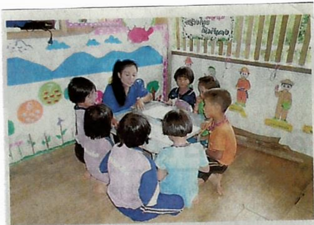
มุ่มอ่านหนังสือของเด็กๆ