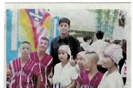
น้องๆ ถ่ายภาพกับนักแสดงที่ชื่นชอบ

ส่วนหนังสือแบบเรียนที่ใช้สอนกันอยู่มีเพียงชั้นปีละ 2 เล่มเท่านั้น ครูย้ายมาสอนที่นี่ 5 ปีแล้วยังไม่เคยเปลี่ยนหนังสือชุดใหม่เลย อย่างเช่นหนังสือแบบเรียนวิชาภาษาไทย ป.1 ปกและบทที่ 1 ก็หายไปแล้ว ครูจึงต้องสอนข้ามเลยไปบทที่ 2"