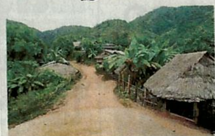
บรรยากาศในหมู่บ้านปกากะญอ

ศูนย์หนังสือจุฬาลงกรณ์มหาวิทยาลัย และสำนักงานจัดการทรัพย์สิน จุฬาฯ ร่วมกันสร้างสรรค์กิจกรรม "จัดรัฐสภามอบจุรีบุ๊คแฟร์ ครั้งที่ 6 : มหัศจรรย์วันหนังสือ" ผ่านกิจกรรม "เสริมความรัก สร้างความรู้ ศูนย์ที่ห่างไกล" พร้อมสร้างสังคมไทยให้เป็นสังคมแห่งการอ่าน