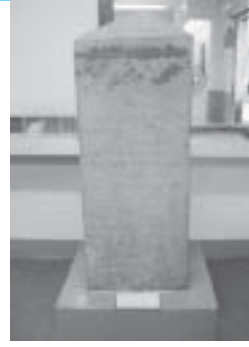
หลักศิลาจารึก