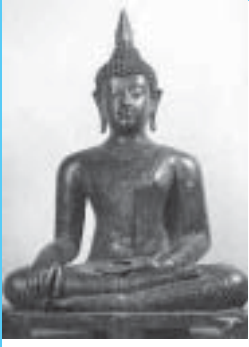
พระพุทธรูปปางมารวิชัย