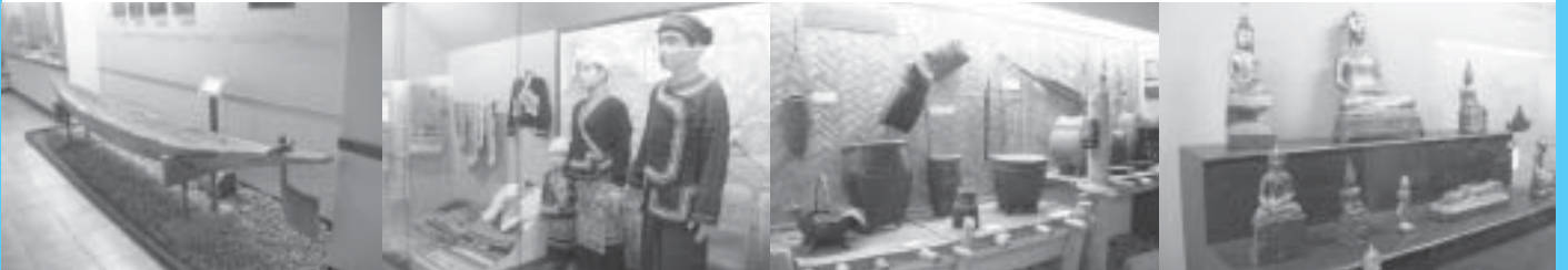
บรรยากาศการจัดพื้นที่แสดงภายในพิพิธภัณฑสถานแห่งชาติเชียงใหม่

พิพิธภัณฑสถานแห่งชาติเชียงใหม่จัดเป็นพิพิธภัณฑสถานประจำแหล่งโบราณคดีเมืองเชียงใหม่ ซึ่งเป็นเมืองที่สำคัญยิ่งเมืองหนึ่งในประวัติศาสตร์ของอาณาจักรล้านนา มีแหล่งโบราณคดีทั้งสมัยก่อนประวัติศาสตร์ และสมัยประวัติศาสตร์ ปรากฏอยู่เป็นจำนวนมาก ฉะนั้น การจัดแสดงในพิพิธภัณฑสถานแห่งนี้ จึงมุ่งเน้นไปในเรื่องราวของประวัติศาสตร์ และโบราณคดีที่เกี่ยวข้องกับการตั้งหลักแหล่งของชุมชน เครื่องมือเครื่องใช้ของมนุษย์ในสมัยก่อนประวัติศาสตร์ยุคสังคมล่าสัตว์ และสังคมเกษตรกรรม เรื่อยมาจนถึงสมัยประวัติศาสตร์ จำแนกโบราณวัตถุที่ได้จากการขุดแต่งโบราณสถานในเมืองเชียงใหม่ ออกเป็นกลุ่มๆ ตามแหล่งที่ขุดพบ พร้อมทั้งให้ข้อมูลทางวิชาการเกี่ยวกับแหล่งโบราณคดี เพื่อประโยชน์สำหรับนักท่องเที่ยว ในส่วนพื้นที่ของการจัดแสดงนั้น ถูกแบ่งออกเป็น 3 ส่วน ได้แก่