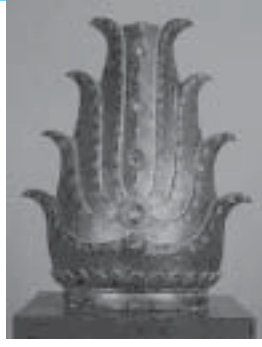
เปลวรัศมี งมได้ในแม่น้ำโขง