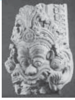
เกียรติมุขอายุราว