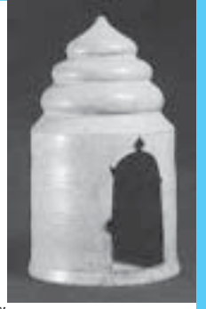
ชุ่มพระพุทธรูปเคลือบใส