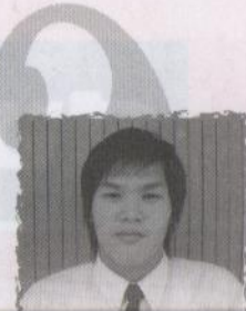
ขมาพึงความคิดที่ นายกองคการบริ ให้เข้มแข็งเพ้นหาจ ด้จัดคณคณ...