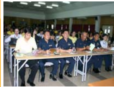
คณะรัฐศาสตร์จุฬาลงกรณ์มหาวิทยาลัย วันที่ 3 กันยายน 49