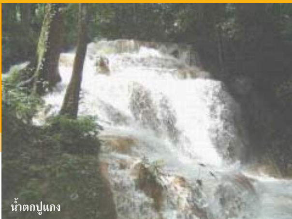
น้ำตกปูแกง

สำหรับนักท่องเที่ยวที่สนใจ กิจกรรมท่องเที่ยวเชิงธรรมชาติและต้องการจะพักค้างแรม กรุณาติดต่อล่วงหน้าได้ที่ ศูนย์บริการนักท่องเที่ยวของอุทยานแห่งชาติดอยหลวง สามารถเข้ามาขอรับบริการข้อมูลได้ทุกวันไม่เว้นวันหยุดราชการ ระหว่างเวลา 08.00 – 16.30 น. โทรศัพท์ 053-609042