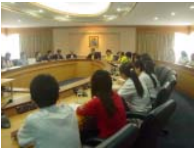
มหาวิทยาลัยปักกิ่งและ มหาวิทยาลัยภาษาต่างประเทศ วันที่ 7 สิงหาคม 49