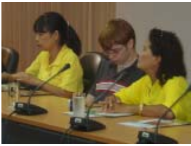
โรงเรียนตากพิทยาคม วันที่ 2 ตุลาคม 49