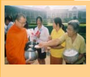
พิธีถวายสักการะพระราชนครศรีธรรมราชและตั้งบาตรพระพุทธรูปล้านอน 99 รูป