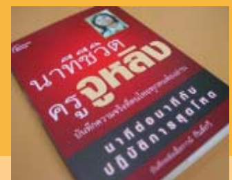
หมายเหตุ : ชื่อหนังสือ: นาทีชีวิตครูจุหลัง สำนักพิมพ์: อนิเมท กรุ๊ป ราคา: 120 บาท

เหตุชาวบ้านกุจิงลือปะ ต.เฉลิม อ.ระแงะ จ.นราธิวาส บุกเข้าปิดล้อมโรงเรียนประจำหมู่บ้านแล้ว จับครูสตรีไทยพุทธเป็นตัวประกัน เพื่อกดดันเจ้าหน้าที่ ให้ปล่อยตัวคนในหมู่บ้านที่ถูกจับไปสอบสวนตามลหมายจับ และเมื่อเวลาผ่านไปขอเรียก ร้องของชาวบ้านไม่ได้รับการตอบสนองจากเจ้าหน้าที่ ชาวบ้านจึงบุก เข้าไปรุมทำร้าย ครูสตรีทั้งสองอย่างโหดร้าย ป่าเถื่อน ไร้มนุษยธรรม จนครูได้รับบาดเจ็บสาหัสโดย เฉพาะครูจุหลังอาการสาหัสถึงขั้นโคมาไม่รู้สีกตัว นอนรักษาตัวเป็นเจ้าหญิงนิทราในห้องไอซียูมานานนับแรมเดือน