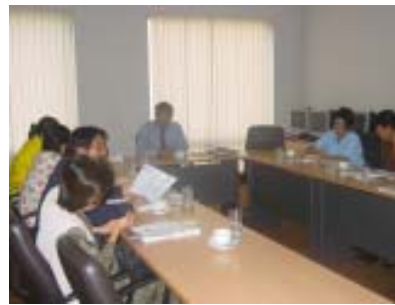
ม.ราชภัฏรำไพพรรณี วันที่ 8 สิงหาคม 49