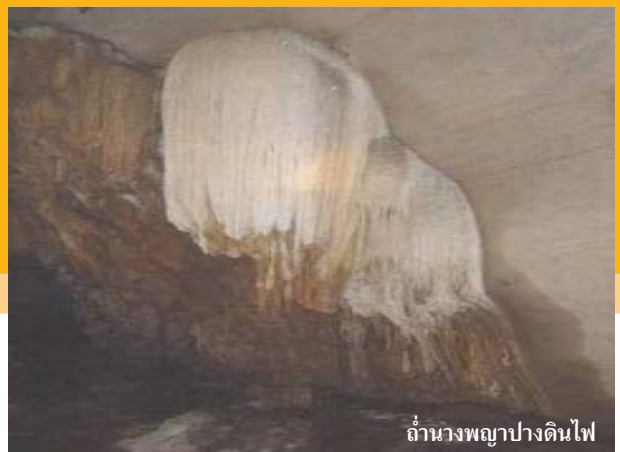
ถ้ำนางพญาปางดินไฟ