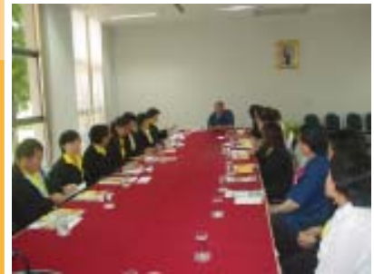
มหาวิทยาลัยเกริก วันที่ 3 ตุลาคม 49