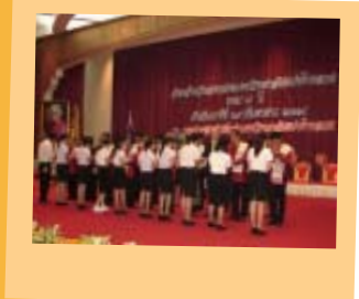
พิธีทางศาสนาและมอบทุนการศึกษาประจำปีการศึกษา 2549