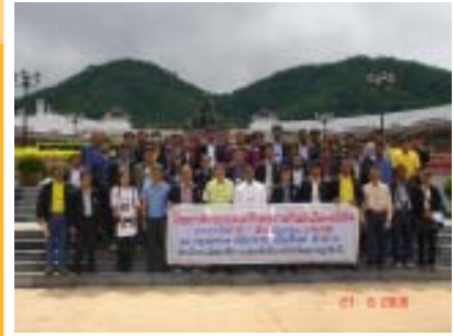
องค์กรปกครองส่วนท้องถิ่นสุราษฎร์ธานี วันที่ 6 สิงหาคม 49