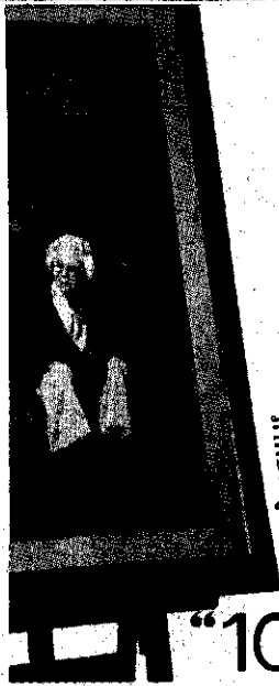
ภาพ ศิลปะ