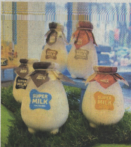
▲ ซุปเปอร์มิลค์สดจากฟาร์มลพบุรี งาน Fresh Foods From Farm

●● 26-29 มิ.ย. ตลาดนัดโซ่ห้วย ครั้งที่ 6 นำเสนอไอเดียความคิดสร้างสรรค์เพื่อ 'ร้านโซ่ห้วยไทย' ต่อยอดทางธุรกิจและเติบโตอย่างยั่งยืนผ่านกิจกรรมมากมาย เช่น การให้คำแนะนำการจัดการร้านค้าปลีก แนวคิดไอเดียรูปแบบการจัดร้านใหม่ๆ การจัดเรียงสินค้า, การจัดแสดงร้านโมเดลผลงานประกวดการออกแบบร้านโซ่ห้วยที่ชนะเลิศในโครงการประกวด 'โซ่ห้วย โซ่เสน่ห์ ปีที่ 2' ปรับปรุงร้านเก่าให้ดึงดูดลูกค้า, แนวคิดการต่อยอดธุรกิจ แผนงานการพัฒนาธุรกิจที่อยู่รอดในยุคการแข่งขัน