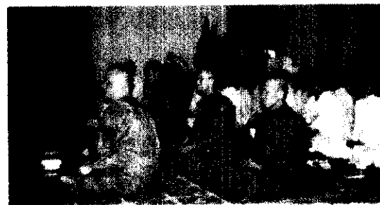
กิจกรรมที่ได้จัดขึ้นในวันสำคัญทางพระพุทธศาสนา

๘๕๘ ๖๐๓๐ Fax.๐๖๒-๘๕๘ ๖๐๓๕ สำหรับขั้นตอนการก่อสร้างวัดมีดังนี้ ขั้นตอนที่ ๑ ชื่อที่ดินในหมู่บ้านเกรทเซินบาค เขตจังหวัดโซโลธูร์น มีเนื้อที่ทั้งสิ้น ๓,๔๐๑ ตารางเมตร (ประมาณ ๒ ไร่เศษ) ราคา ๙๙๓,๐๐๐ ฟรังก์สวิส คิดเป็นเงินไทยขณะนั้น ประมาณ ๑๗ ล้านบาท และได้รับโอนเป็นกรรมสิทธิ์ของวัดเรียบร้อยแล้ว เมื่อวันที่ ๔ มกราคม ๒๕๓๖