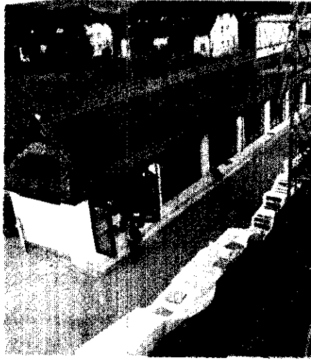
ศาลาอเนกประสงค์

ทางศาสนา และใช้เป็นห้องรับแขกด้วย หลังจาก สร้างขั้นตอนที่ ๓ เสร็จแล้ว ที่อยู่ชั่วคราวจะเหลือ เป็นศาลา สิ้นค่าใช้จ่าย ๕๐๐,๐๐๐ ฟรังก์สวิส คิดเป็นเงินไทยประมาณ ๙ ล้านบาท