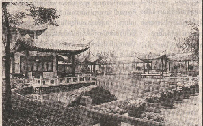
บรรยากาศภายใน ศูนย์ภาษาและวัฒนธรรมจีนสิรินธร สะท้อนสถาปัตยกรรมจีนแท้ มีสวนน้ำตรงกลางแบบซูโจว สถาปัตยกรรมที่ร่มรื่น

ศูนย์ภาษาและวัฒนธรรมจีนสิรินธร มีลักษณะเป็นสถาปัตยกรรมจีนแท้