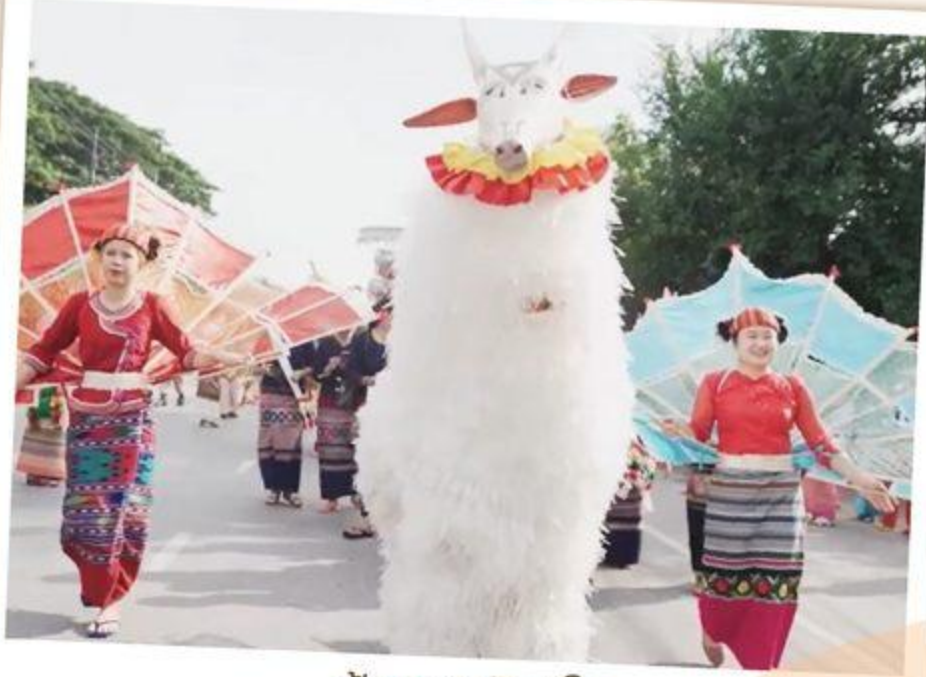
พ่อนนท พ่อนโต