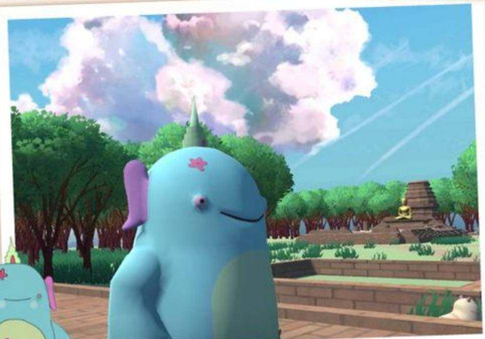
Chiang saen Metaverse