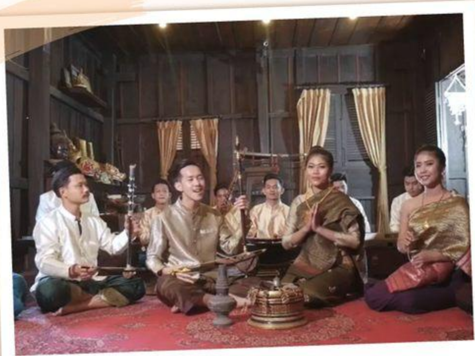
ขับท่อมหลวงพระบาง