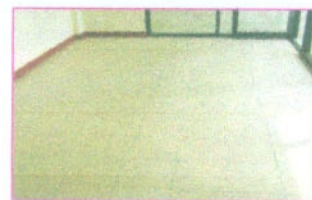
พื้นกระเบื้องเซรามิกภายใน