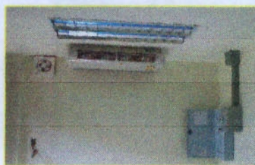
งานระบบสุขาภิบาลและปรับอากาศ