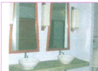
สุขภัณฑ์ในห้องน้ำ