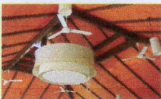
พัดลมติดเพดานภายใน