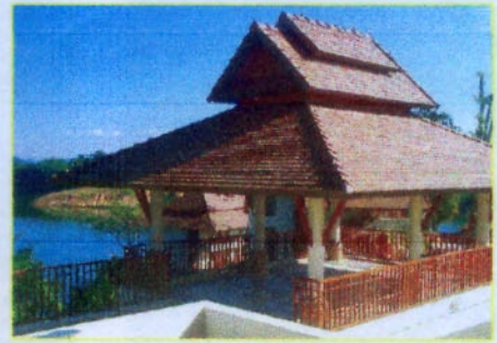
ศาลาในส่วนลานรับประทานอาหาร