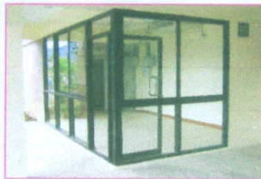
ประตูกระจกอลูมิเนียม (ชั้นล่าง)