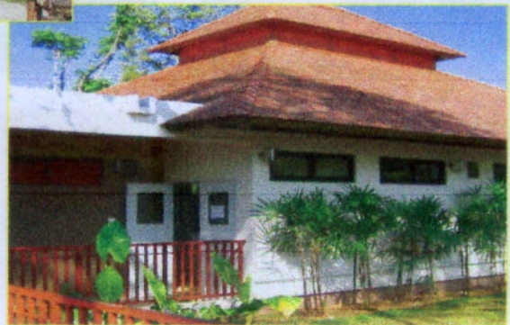
บริเวณด้านข้างอาคาร