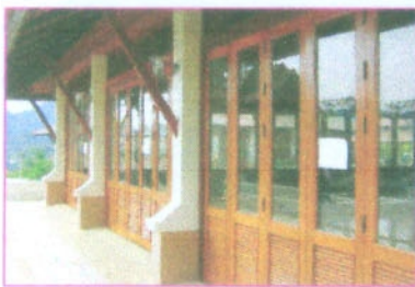
ประตูปานเชื่อม (ชั้น 2)