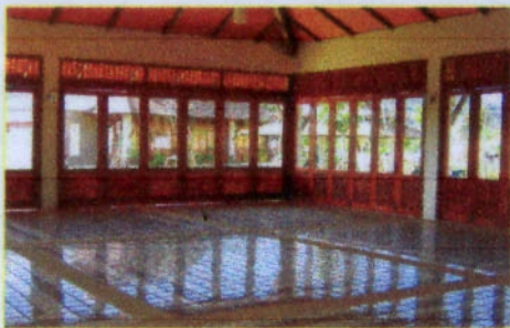
ภายในบริเวณอาคารภัตตาคาร