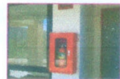
ตู้ดับเพลิงในอาคาร