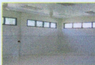
ห้องเก็บอาหารภายในอาคาร