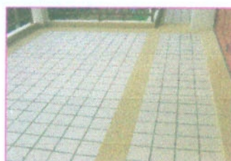
พื้นปูกระเบื้องไฟโรแกรส ผสมทรายล้าง (บริเวณระเบียง)