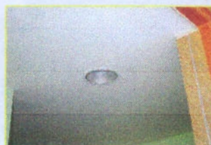
ดวงโคมภายในห้อง