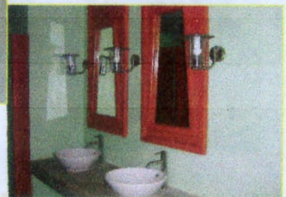
สุขภัณฑ์ในห้องน้ำ