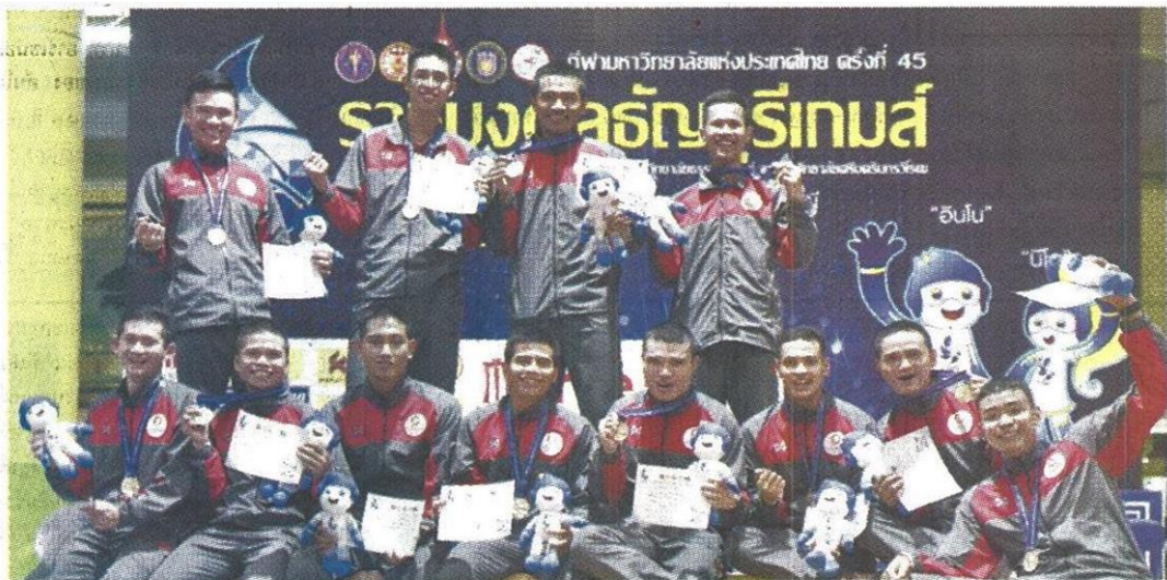
ทองทีมชุด ทีมเซปักตะกร้อหนุ่มจาก ม.กรุงเทพมหานครบุรี คว้าเหรียญทองประเภททีมชุดมาครองได้สำเร็จหลังชนะเลิศ ม.รัตนบัณฑิตในรอบชิงฯ 2-1 ทีม การแข่งขันกีฬามหาวิทยาลัยแห่งประเทศไทยครั้งที่ 45 "ราชมณฑลธัญบุรีเกมส์" มทร.ธัญบุรี เมื่อ 25 ม.ค. 61