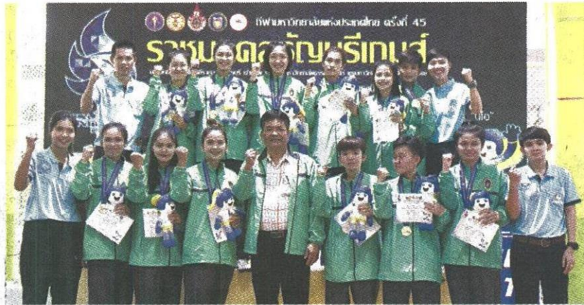
ทองสมัยที่ 6 ทีมเซปักตะกร้อสาวจากสถาบันการพลศึกษาขึ้นรับเหรียญทองทีมชุดหญิง พร้อมสร้างสถิติ 6 สมัยซ้อนอย่างยิ่งใหญ่ การแข่งขันกีฬามหาวิทยาลัยแห่งประเทศไทย ครั้งที่ 45 "ราชมณฑลธัญบุรีเกมส์" มทร.ธัญบุรี เมื่อ 25 ม.ค. 61

หัวข้อข่าว: กรุงเทพมหานครพาดสนั่นชีวิตะกร้อชุดชายสมัย10'พรบิเวณ'วัดทองชนไก่'เพียงขวัญ'ถอนว้ยน้ำ