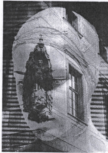
⤴ “เรามองอย่างที่โลกภายนอกอยากให้เห็น แต่ภายในของพวกเขาเหมือนกันหรือเปล่า?” ยีรี ชมมลลาร์