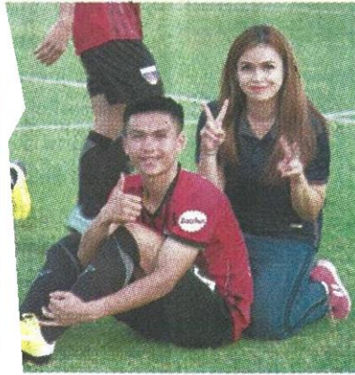
ประธานสโมสรนครหลวงเวียงจันทน์ ยูไนเต็ต "มาตามโบ" ดูแลนักฟุตบอลอย่างใกล้ชิด