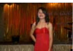
นี่แหละ สาว MBA