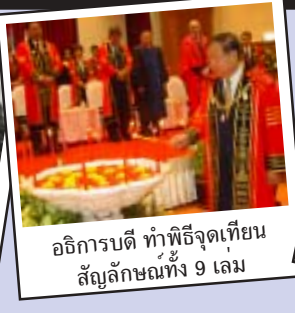
อธิการบดี ทำพิธีจุดเทียน สัญลักษณ์ทั้ง 9 เล่ม