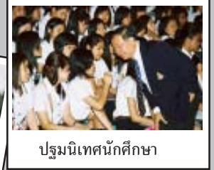
ปฐมนิเทศนักศึกษา

มหาวิทยาลัยแม่ฟ้าหลวงได้จัดให้มีกิจกรรมต้อนรับนักศึกษาใหม่เป็นประจำทุกปี โดยได้จัดกิจกรรมต่างๆ ที่เป็นประโยชน์ในการปรับตัวตลอดจนสร้างความรักความผูกพันระหว่างนักศึกษาใหม่กับสถาบันและนักศึกษารุ่นพี่ โดยจะก่อให้เกิดความอบอุ่นประทับใจในความเป็นพี่น้องร่วมสถาบันทำให้นักศึกษาเกิดความรักต่อสถาบัน ตลอดจนการรวมกิจกรรมอนุรักษ์สิ่งแวดล้อม กิจกรรมทำนุบำรุงศิลปวัฒนธรรมอันดีงามของภาคเหนือ