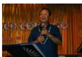
คณบดีสำนักวิชาศิลปศาสตร์ ขึ้นกล่าวแสดงความยินดีกับบัณฑิต MBA รุ่น 2