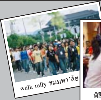
walk rally ชมมหาาลัย