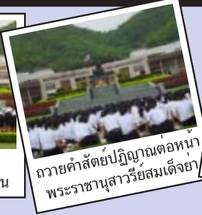
ถวายคำสัตย์ปฏิญาณต่อหน้า พระราชานุสาวรีย์สมเด็จพระ