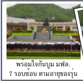
พร้อมใจกันบูม มฟล. 7 รอบซ้อน ตามอายุของรุ่น