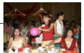
เกมส์หนีบลูกโป่ง งานนี้ MPA 2 คว้าแชมป์ไปครอง