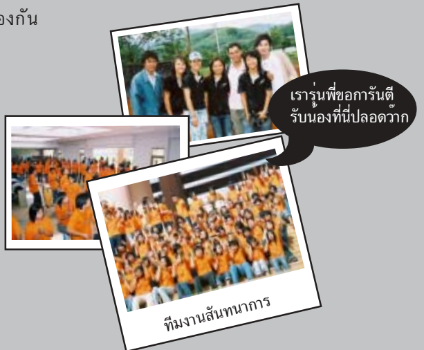
เรารุ่นพี่ขอการันตี รับน้องที่นี้ปลอดภัย

ประเพณีรับน้องของมหาวิทยาลัยแม่ฟ้าหลวง นับได้ว่าเป็นมิติใหม่ที่จะปรับเปลี่ยนการรับน้องในแบบเดิมๆ ให้กลายเป็นการสร้างความรักประทับใจรักสถาบันและที่สำคัญยิ่งการปรับตัวให้เข้ากับสังคมและสิ่งแวดล้อมของนักศึกษาใหม่ที่จะนำไปใช้ได้ตลอดจนจบการศึกษาและการดำเนินชีวิตต่อไป