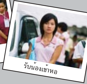
รับน้องเข้าหอ