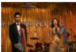
พิธีกรคู่ขวัญ