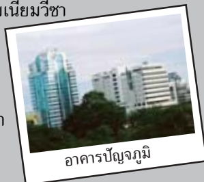
อาคารปัญญาภูมิ

โทรศัพท์ 02-679-0038-9 โทรสาร 02-679-0038