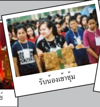
รับน้องเข้าช้่ม