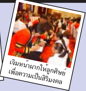
เจิมหน้าผากให้ลูกศิษย์ เพื่อความเป็นสิริมงคล

มหาวิทยาลัยแม่ฟ้าหลวง ได้จัดให้มีพิธีไหว้ครูและรับเป็นศิษย์ และพิธีถวายราชสักการะแด่สมเด็จพระศรีนครินทราบรมราชชนนี ประจำปีการศึกษา 2548 ณ หอประชุมสมเด็จพระเจ้า และลานเฉลิมพระเกียรติ เมื่อวันที่พฤหัสบดีที่ 16 มิถุนายน ที่ผ่านมา