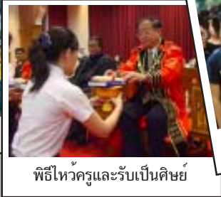
พิธีไหว้ครูและรับเป็นศิษย์