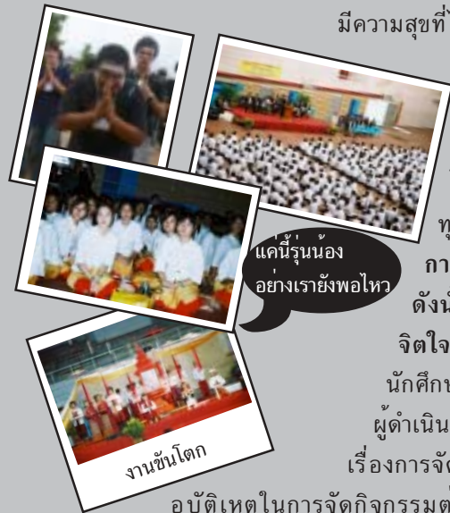
แค่มีรุ่นน้อง อย่างเราช่างพอไหว

ในแต่ละปีมีนักศึกษาใหม่เข้ามาศึกษาภายในมหาวิทยาลัยแม่ฟ้าหลวงจากหลายภูมิภาค ดังนั้น นักศึกษาแต่ละคนจึงมีสภาพร่างกายและจิตใจที่แตกต่างกันออกไป ซึ่งอาจส่งผลไปยังกิจกรรมการรับน้องที่จัดขึ้น อาทิเช่น นักศึกษาบางกลุ่มอาจยอมรับและมีความสุขที่ได้เข้าร่วมกิจกรรมที่ทางมหาวิทยาลัยจัดขึ้น ซึ่งแตกต่างจากนักศึกษาอีกบางกลุ่มที่อาจ