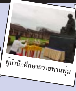
ผู้นำนักศึกษาถวายพานพุ่ม