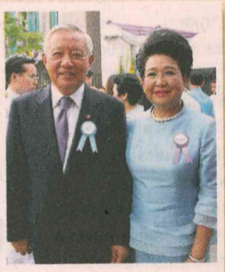
พล.อ.วินัย-ศศิณี ภัททิยกุล