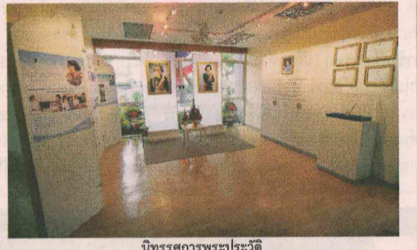
นิทรรศการพระประวัติ