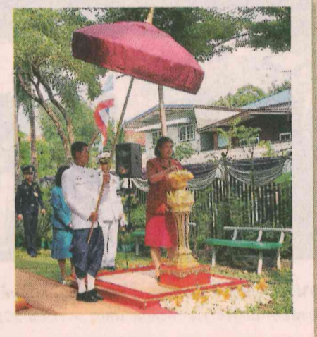
พระเนตรนิทรรศการพระประวัติและพระกรณียกิจต่อเด็กและผู้ยากไร้ทอดพระเนตรห้องของเล่นและนิทานห้องเลี้ยงเด็ก การแสดงของ