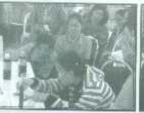
วิธีการตรวจสอบคุณภาพ ของน้ำสัสมันไม้