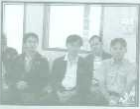
ทีมวิทยากรและผู้จัด