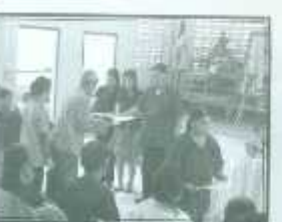
รับไปประกาศนียบัตรจาก ขานนายอำเภอเด่นชัย