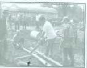
ผู้เข้าร่วมช่วยกันเตรียมอุปกรณ์