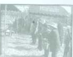
เริ่มปฏิบัติการ ร่วมแรงช่วยกัน