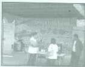
บริหารศทางพลังงานจากสำนัก วิทยาการพลังงานภาค 9