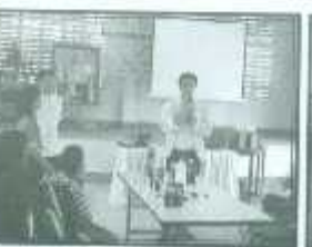
แนะนำกลยุทธ์ทางการตลาด และกาทำงานของอววน.