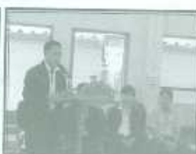
กล่าวรอาแทนโดยนายกลงศการ ขวบริหารส่วนตำบลแม่จ๊ะ