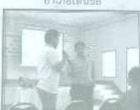
บรรยากาศของภาการรยาและสร้างความเข้าใจก่อนเริ่มปฏิบัติ