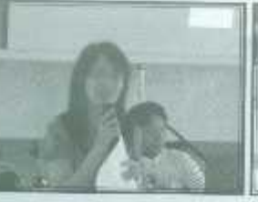
วิทยากรจากมหาวิทยาลัยแม่ใจ วิทยาเขตแพร่