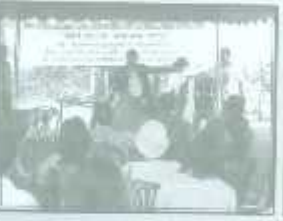
วิทยากรแนะนำอุปกรณ์