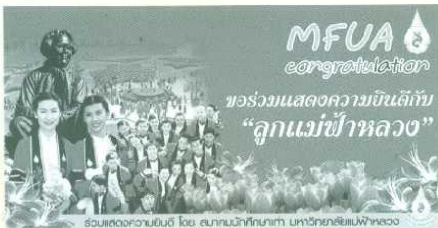
ขอแสดงความยินดี โดย สถาบันนักศึกษาเก่า มหาวิทยาลัยแม่ฟ้าหลวง

ขณะเดียวกันสถาบันต่างๆ จากทั่วประเทศได้เปิดบูธให้ข้อมูลศึกษาต่อ โดยงานนี้ได้รับความสนใจจากนักเรียนภายในจังหวัดเชียงราย และจังหวัดใกล้เคียงอย่างคึกคัก ซึ่งในวันแรกของการจัดงานมีนักเรียนมาร่วมงานกว่า 5,000 คน