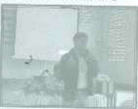
วิทยากรจากสำนักวิชาการ พลังงานภาค 9