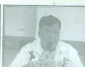
เปิดการอบรมโดยท่านนาย ขวอำเภอเด่นชัย