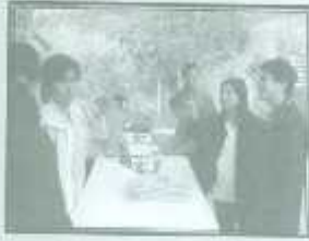
นรพภกษการลงทะเลเบียน