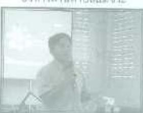
วิทยากรจากมหาวิทยาลัยแม่ใจ