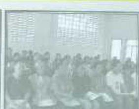
ผู้เข้าร่วมอบรม