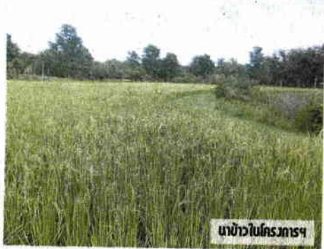
นาข้าวในโครงการฯ