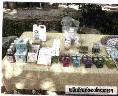
ผลิตภัณฑ์ของโครงการฯ

การเดิมเคยมีความอุดมสมบูรณ์ แต่ถูก แผ้วถางพื้นที่และทำการเกษตรเชิงเดี่ยว ต่อเนื่องหลายปี จนที่ดินที่เคยมีความ อุดมสมบูรณ์กลับเสื่อมโทรม ประกอบ อาชีพเกษตรกรไม่ค่อยได้ผล เรียกว่าเป็น พื้นที่ที่คุณภาพดินแย่ที่สุดในประเทศไทย ก็ว่าได้ เกษตรกรจึงทูลเกล้าฯ ถวายที่ดิน แด่สมเด็จพระศรีนครินทร์ราชชนนี จำนวนสามแปลง รวมเนื้อที่ประมาณ 340 ไร่ แปลงที่หนึ่งเป็นชื่อในพระนามาภิไธย สมเด็จพระศรีนครินทร์ราชชนนี แปลง