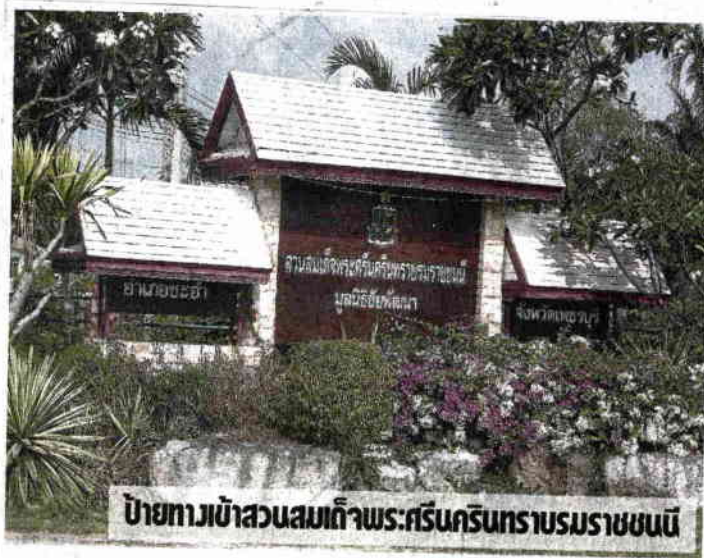
ป้ายทางเข้าสวนสมเด็จพระศรีนครินทร์ราชชนนี

การเดิมเคยมีความอุดมสมบูรณ์ แต่ถูก แผ้วถางพื้นที่และทำการเกษตรเชิงเดี่ยว ต่อเนื่องหลายปี จนที่ดินที่เคยมีความ อุดมสมบูรณ์กลับเสื่อมโทรม ประกอบ อาชีพเกษตรกรไม่ค่อยได้ผล เรียกว่าเป็น พื้นที่ที่คุณภาพดินแย่ที่สุดในประเทศไทย ก็ว่าได้ เกษตรกรจึงทูลเกล้าฯ ถวายที่ดิน แด่สมเด็จพระศรีนครินทร์ราชชนนี จำนวนสามแปลง รวมเนื้อที่ประมาณ 340 ไร่ แปลงที่หนึ่งเป็นชื่อในพระนามาภิไธย สมเด็จพระศรีนครินทร์ราชชนนี แปลง