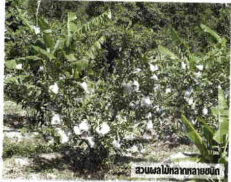
สวนผลไม้หลากหลายชนิด