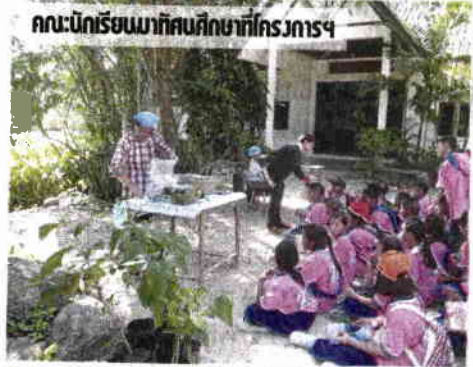
คณะนักเรียนมาทัศนศึกษาที่โครงการฯ

พืชต่างๆ ที่ถูกต้องตามหลักวิชาการ อาทิ ระบบการปลูกพืชโดยมีผลไม้เป็นหลักการ ทำการเกษตรแบบยั่งยืน ทฤษฎีใหม่ขั้นที่ 1 หรือเกษตรทฤษฎีใหม่ วนเกษตร และ การลดการใช้สารเคมี เน้นการปลูกพืช