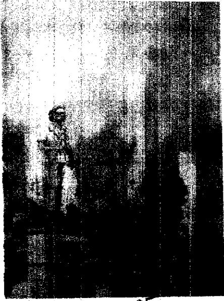
05 "ส่วนสมเด็จพระศรีนครินทร์ ต้องจัดให้มริน ร่มเย็น และสวยงาม รักษาธรรมชาติไว้ ไม่ต้องใหญ่โตมากนัก ให้ประชาชนเข้าไปใช้โดยไม่ต้องเสียค่าใช้จ่ายใดๆ ทั้งสิ้น" พระราชดำรัส สมเด็จพระศรีนครินทราบรมราชชนนี พระราชทานแก่คณะกรรมการบริหารมูลนิธิส่วนสมเด็จพระศรีนครินทร์

ณ ทอศิลป์สมเด็จพระนางเจ้าสิริกิติ์ พระบรมราชินีนาถ มูลนิธิส่วนสมเด็จพระศรีนครินทร์ และคณะผู้ทำงานโครงการ "คิดถึงสมเด็จพระย่า" ได้แถลงข่าว "การแสดงภาพวาดและการประมูลภาพวาด ส่วนสมเด็จพระศรีนครินทร์" ที่จะจัดแสดงในวันที่ 18 กรกฎาคม ถึงวันที่ 7 สิงหาคม และในวันที่ 7 สิงหาคม กำหนดให้เป็นวันประมูลภาพ ทั้งนี้ ในปี 2548 นับเป็นปีที่สมเด็จพระศรีนครินทราบรมราชชนนี เสด็จสู่สวรรคาลัยครบ 10 ปี มูลนิธิส่วนสมเด็จพระศรีนครินทร์ ร่วมกับบริษัท ทาดทิพย์ จำกัด (มหาชน) บริษัท โตชิบา ไทยแลนด์ จำกัด และศิลปินที่มีชื่อเสียงระดับประเทศ ได้ร่วมกันเนรมิตรำลึกถึงพระมหากรุณาธิคุณและแสดงความจงรักภักดีต่อสมเด็จพระศรีนครินทราบรมราชชนนี โดยการจัดโครงการ "คิดถึงสมเด็จพระย่า" ซึ่งจะนำภาพวาดมาจัดแสดงและประมูลจำนวน 120 ภาพ ภาพศิลปะจำนวน 120 ภาพที่จะจัดแสดงเป็นฝีมือของศิลปินระดับแนวหน้าของประเทศทั้งสิ้น 34 คน อาทิ บริษัท เกาทอง ประเทือง เอมเจริญ ณะ เลลาภักกุล พิษณุ คุณนิมิต ธงชัย รักปทุม ดาวร โกอุดมวิทย์ สมศักดิ์ รักษ์สุวรรณ สมโกชน์ สิงห์ทอง อังอร ทอมสุวรรณ อรัญ หงษ์ไต้ ไพรวลัย ดาเกลี้ยง เป็นต้น ซึ่งวาดภาพส่วนสมเด็จพระศรีนครินทร์ และพระราชทานสำเนาให้มูลนิธิส่วนสมเด็จพระศรีนครินทราบรมราชชนนี