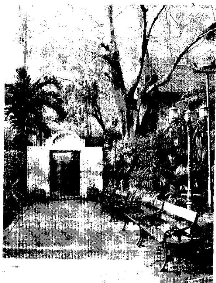
ต้นไม้ใหญ่ร่มรื่นภายในอุทยานฯ

สำหรับสถานที่ที่เป็นอุทยานฯ สมเด็จพระเจ้าพี่นางเธอฯ นี้ เดิมเป็นที่ดินของ นายแดง นานา และนายเล็ก นานา ซึ่งได้พร้อมใจกันน้อมเกล้าฯ ถวายที่ดินจำนวน 4 ไร่ ในบริเวณชุมชนหลังวัดดอนงค์รามให้เป็นสวนสาธารณะของชุมชน โดยในตอนกลางของพื้นที่นั้นเป็นที่ตั้งของบ้านเจ้าพระยาศรีพิพัฒน์วีรชนราชโกษาธิบดี (แพ บุนนาค) อธิบดีกรมพระคลังสินค้าในรัชกาลที่ 5 ซึ่งภายหลังได้รื้อออกไป แต่ก็เก็บรวบรวมบางส่วน รวมถึงชุมชนประจักษ์ และกำแพงเก่าบางส่วนก็ยังคงไว้