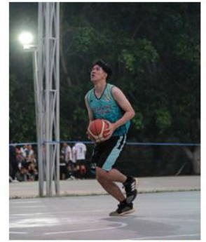
ฝ่ายคณะกรรมการนักศีกษาและศีกษาเก่า