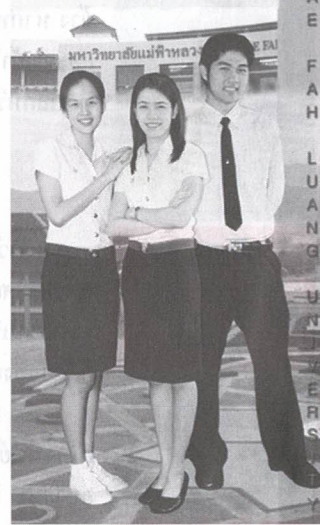
มหาวิทยาลัยแม่ฟ้าหลวง

พบว่า 174 คน (74%) มีความพอใจ ขณะที่ 61 คน (26%) ยังไม่พอใจ โดยให้เหตุผลเรียงตามลำดับคือ ค่าตอบแทนต่ำ 39.3% ไม่ได้ใช้ความรู้ที่เรียนมา 16.4% และขาดความก้าวหน้า 16.4% และอื่น ๆ 27.9% อย่างไรก็ตามเมื่อเปรียบเทียบกับภาวะการมีงานทำขอ