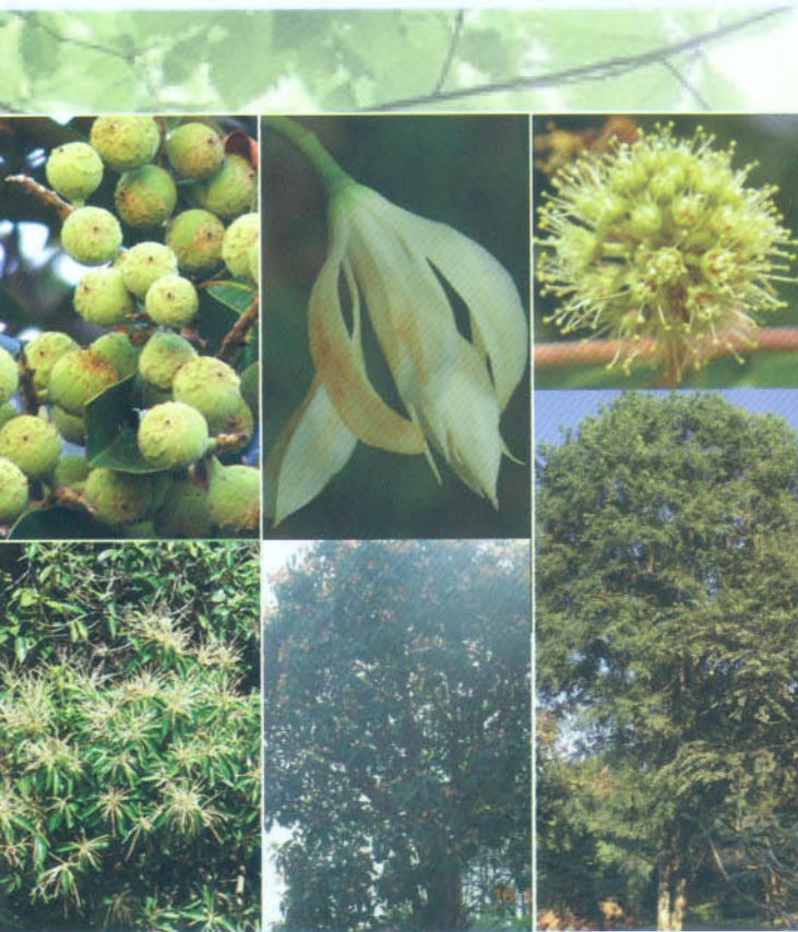
ก่อตาหมู Castanopsis sp. จำปีป่า Michelia baillonii Finet & Gagnep. ตะเคียน Anogeissus acuminata Guill.