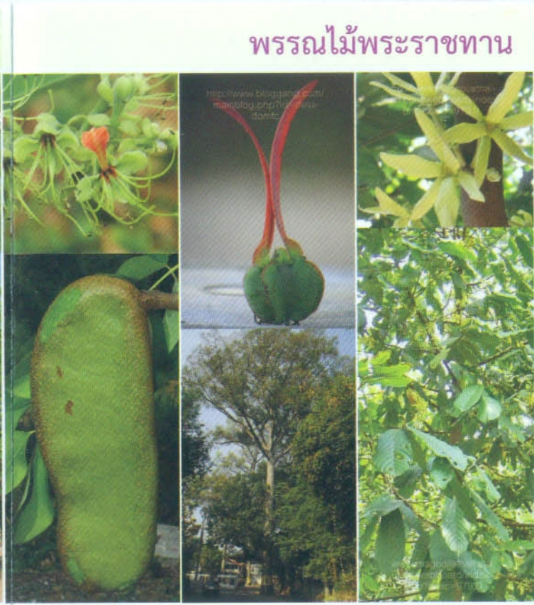
มะค่าโมง Afzelia xylocarpa (Kurz) Craib ยางนา Dipterocarpus alatus Roxb. ยางโอน Polyalthia viridis Craib

เนื่องในโอกาสที่สมเด็จพระเทพรัตนราชสุดาฯ สยามบรมราชกุมารี ทรงเจริญพระชนมายุ ๖๐ พรรษา ในวันที่ ๒ เมษายน ๒๕๕๘ ด้วยสำนึกในพระกรุณาธิคุณ มหาวิทยาลัยแม่ฟ้าหลวง จึงได้ดำริให้มีโครงการปลูกป่าเพื่อเฉลิมพระเกียรติในโอกาสดังกล่าว คือ “โครงการปลูกป่าเฉลิมพระเกียรติสมเด็จพระเทพรัตนราชสุดาฯ สยามบรมราชกุมารีในโอกาสฉลองพระชนมายุ ๖๐ พรรษา ๒ เมษายน ๒๕๕๘” เพื่อสืบสานแนวพระราชดำริในการอนุรักษ์พืชพรรณของประเทศโดยเฉพาะอย่างยิ่งเพื่ออนุรักษ์พรรณไม้ที่เป็นพรรณไม้ท้องถิ่นในพื้นที่จังหวัดเชียงราย