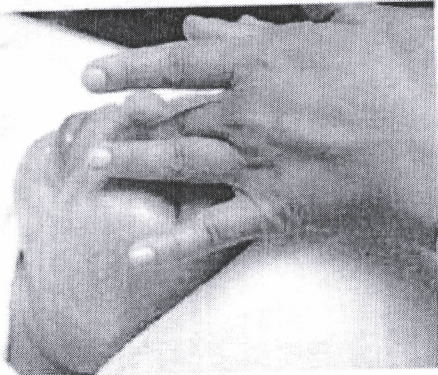
บุคลากรที่ห้องรับแขกของโรงแรม