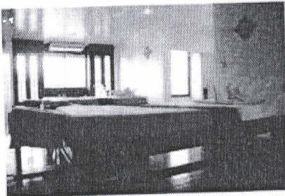
ห้องพักผู้ป่วย

เพื่อผลิตภัณฑ์ผิวที่ตายแล้วให้หลุดออกไปอย่างอ่อนโยน แล้วจึงนวดหน้าอย่างชำนาญเพื่อเป็นการกระตุ้นการไหลเวียนโลหิตและฟื้นฟูสมดุลผิว