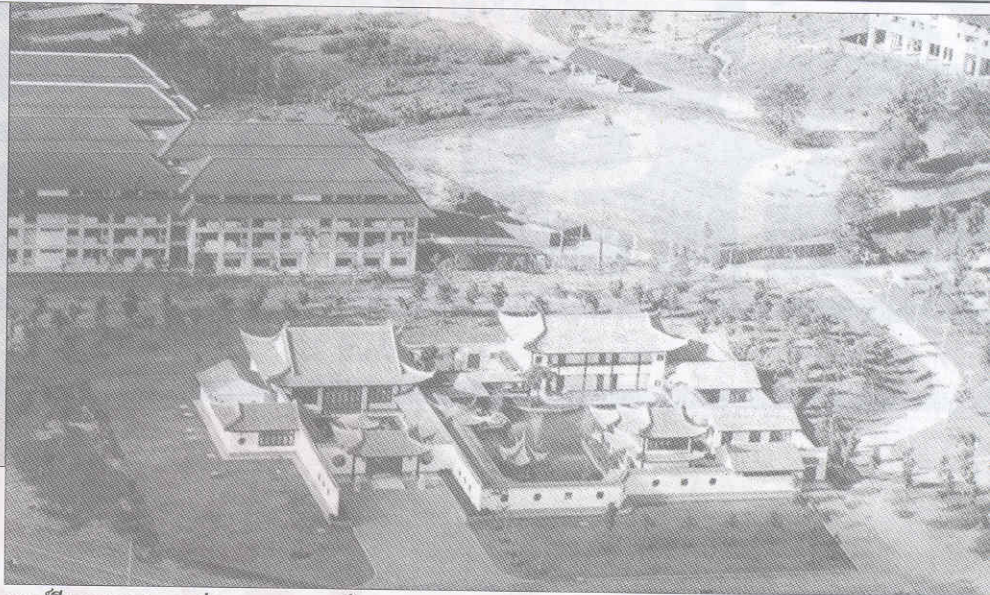
ศูนย์จีนมองจากภาพถ่ายทางอากาศ ปี 2546

“ลินทร” อ่านออกเสียงว่า “ชื่อ หลิน ธง” อันมี เรื่องหยกและบทกวี ที่สมเด็จพระเทพรัตน มาวารี พระราชทานให้มหาวิทยาลัยแม่ฟ้าหลวง คม พุทธศักราช 2546