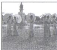
ชนเผ่าชาวเครือไตแม่สายจัดงานสืบสานประเพณีได้นเป็ก ระหว่างวันที่ 1-2 ธันวาคม 2551