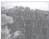
ค่ายเรียนรุดคธรรมปาชีวิตพอเพียง มุ่ง นศ. ชิมชัย เศรษฐกิจพึ่งตนเอง - ประชาธิปไตยชุมชน