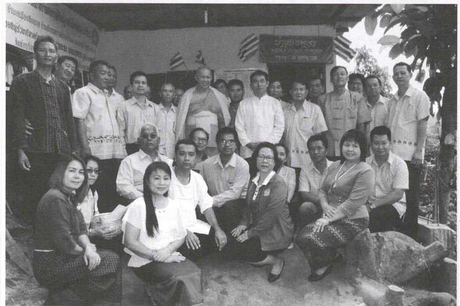
มอบบ้านหอมบุญ อำเภอมืองเชียงราย ร่วมกับเทศบาลตำบลนางแล และชมรมกำนันผู้ใหญ่บ้าน ส่งมอบบ้านหอมบุญ (บ้านรวมบุญ) ให้แก่ผู้พิการและยากจน โดยเริ่มก่อสร้างตั้งแต่วันที่ 5 ตุลาคม 2558 ที่ผ่านมา มีผู้ร่วมสนับสนุนบริจาคก่อสร้างรวมทั้งสิ้นจำนวน 2 แสนบาท ถวายเป็นพระราชกุศลเนื่องในโอกาสวันเฉลิมพระชนมพรรษาพระบาทสมเด็จพระเจ้าอยู่หัวฯ 5 ธันวาคม 2558

นำหุ่นเศรษฐกิจพิเศษชายแดนไปตามกระแส... แน่นละ เพราะไม่ต้องออกแรงอะไร... แต่ที่เรื่องรถไฟเด่นชัย-เชียงราย-เชียงของ กลับเป็นทองไม่รู้ร้อน ทั้งๆ ที่ที่อื่นเขาหากยังล่าช้าทำไม่ได้เพราะคมนาคม-รถไฟเงา เขาก็จะขอให้เอา ม.44 มาใช้... ทำเรื่องอื้ออึงโอเออะไรอยู่เป็นเดือนเป็นปี แต่ที่นี้ของเราหอกการค้าไม่ทำอะไรเลย ได้แต่รอฟ้าดินมาโปรดลมหิตพทร ประเทศที่เขาเจริญแล้ว เขาจะต้องสร้างทางรถไฟวงก่อน อก่างอเมริกาถึงได้