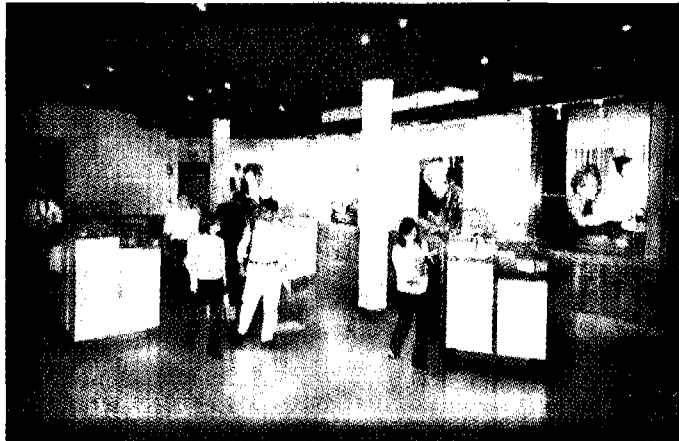
ห้อง "เวลาเป็นของมีค่า"

ใคร ที่ไม่อยากไปรับรังสียูเรเนียม ที่แถมมากับบลมรอนๆ ลองเปลี่ยนแนวไปเที่ยวดอย