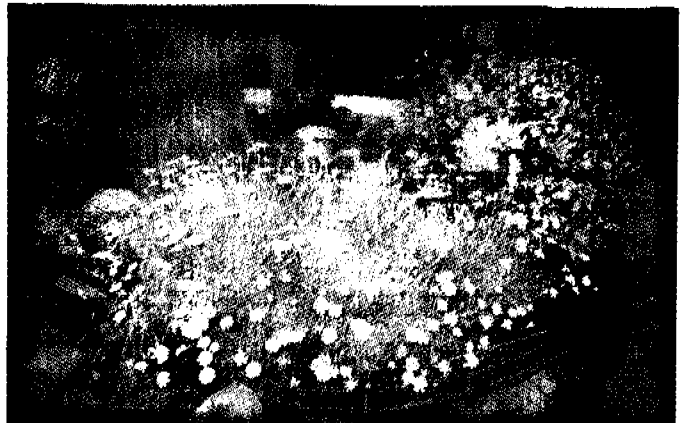
อีกสี้นหน้า "ทอพระราชประวัติ"

นอกจากนี้ยังได้สัมผัสอย่างใกล้ชิดกับพระราชภารกิจต่างๆ ที่ทรงมุ่งขจัดรากเหง้าของความเดือดร้อนที่ราษฎรต้องประสบ ไม่ว่าจะเป็นด้านสุขอนามัยของราษฎรในชนบทที่ห่างไกล ตลอดจนการพัฒนาที่ยั่งยืนของชุมชนมนุษย์ และธรรมชาติแวดล้อม เช่น โครง