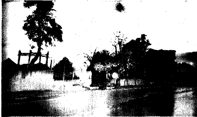
ด้านหน้า "หอพระราชประวัติ" บนดอยตุง