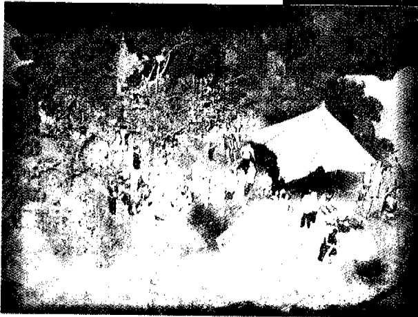
จำลองหน่วยแพทย์เคลื่อนที่ พอ.สว.

ศาสนาทุกศาสนาสอนให้คนทุกคนเป็นคนดี และหลักธรรมคำสอนมีใช้เรื่องยากเกินกว่าจะเข้าใจ และปฏิบัติในห้อง "ภูมิธรรม" จัดแบ่งเป็นสื่อทุก มีคอมพิวเตอร์ระบบทัชสกรีนบอกเล่าปรัชญาชีวิตของสมเด็จพระเจ้า พระพุทธเจ้า ทรงสั่งสอนอะไร, พระพุทธประวัติ ภาพประกอบจากจิตรกรรมฝาผนังบนระเบียงพระอุโบสถวัดพระแก้ว...ถ้าคลิกดูไปเรื่อยๆ วันละ 8 ชั่วโมง ต้องใช้เวลานานถึง 3 ปี