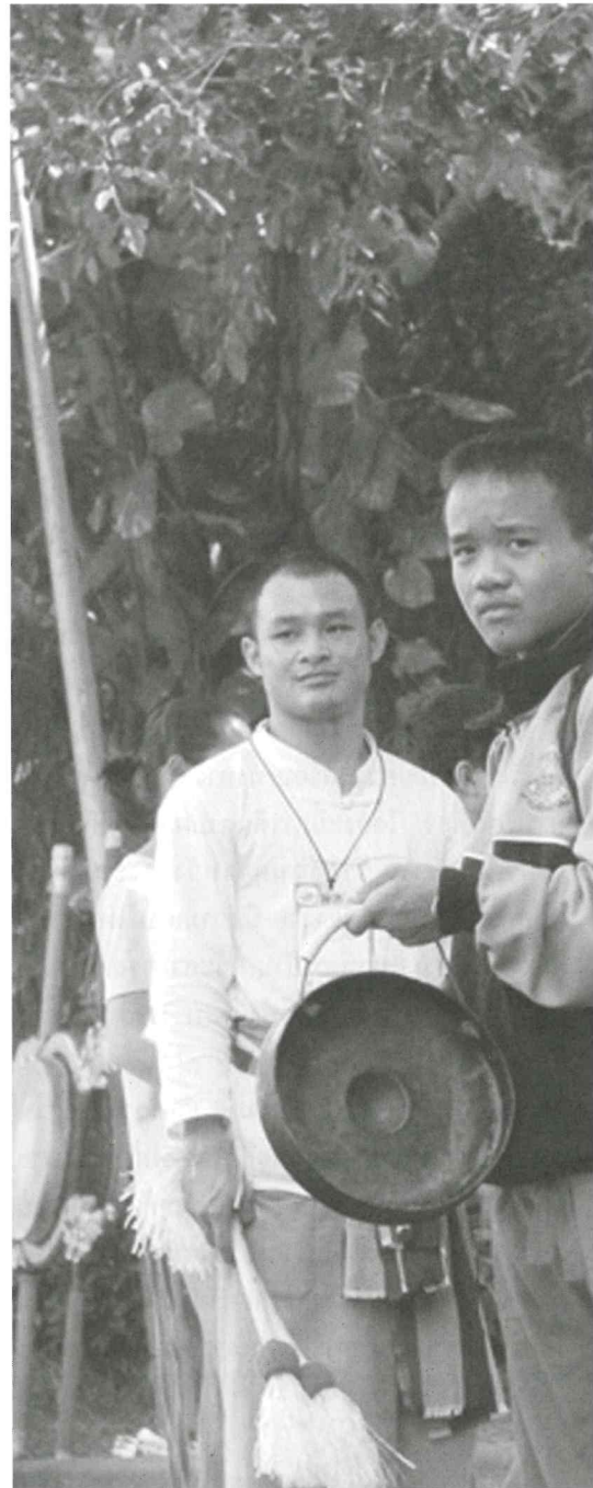
ที่ผ่านมา

“ผมได้ทุนการศึกษา ในพระนามของสมเด็จพระเทพฯ ผมจึงอยากเป็นเยาวชน ผู้เสียสละอยากทำ สิ่งดีๆ เพื่อสังคมไทยบ้าง ประกอบกับอย่างแรก ซึ่งผมมีความชอบ เป็นพื้นฐานส่วนตัวอยู่แล้ว และความตั้งใจ ที่อยากจะอนุรักษ์ เผยแพร่ และสืบสาน ศิลปวัฒนธรรมอันดีเหล่านี้ให้คงอยู่ต่อไปและคาดหวัง ให้เยาวชนด้วยกัน ได้ตระหนักถึงคุณค่าของวัฒนธรรม เพื่อยกระดับจิตใจให้สูงขึ้น นอกจากนี้ ยังเป็นการ