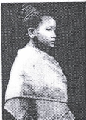
❖ สตรีสูงศักดิ์ในราชสำนักลาว

ผู้สนใจเข้าชมพิพิธภัณฑ์ ได้ทุกวันเวลาราชการ ตั้งแต่ 09.00 น. - 15.30 น. ถ้าต้องการคนนำชมหรือมาเป็นหมู่คณะ ตลอดจนการเยี่ยมชมนอกเวลาราชการและวันหยุดนักขัตฤกษ์ กรุณาติดต่อล่วงหน้า 1 สัปดาห์ โดยติดต่อมายังโครงการจัดตั้งพิพิธภัณฑ์อารยธรรมลุ่มน้ำโขง 053-917067