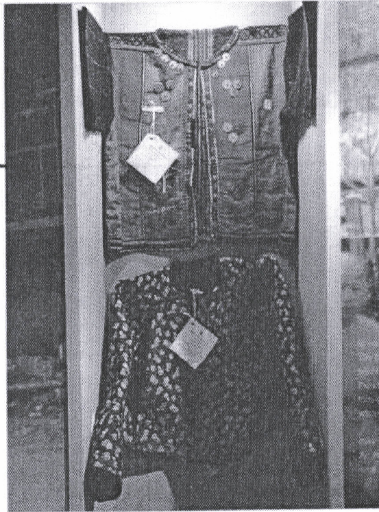
❖ เครื่องแต่งกายพื้นเมืองที่กลายเป็นของล้ำสมัย

อดีต ก่อนจะเข้าสู่พิธีกรรมในส่วนที่สอง การ เผชิญหน้าการล่าอาณานิคม เนื้อหาแสดงให้เห็นถึงการเข้ามาของมหาอำนาจชาติตะวันตกที่เข้ามา กอบโกยผลประโยชน์ กับอาณาจักรต่างๆ ในลุ่มแม่น้ำโขง การขีดเส้นแบ่งการปกครองในรูปแบบอาณานิคมส่งผลถึงความขัดแย้งของผู้คนในลุ่มน้ำโขงจากอดีตจนถึงปัจจุบัน