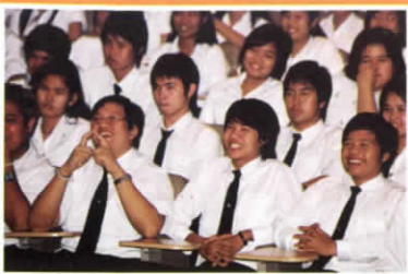
การเรียนการสอน