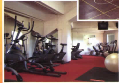
ศูนย์กีฬา, ห้องออกกำลังกาย