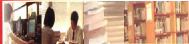
ศูนย์บรรณสารและสื่อการศึกษา