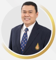
พศ. ดร. นัฐกาญจน์ รุ่งเรือง