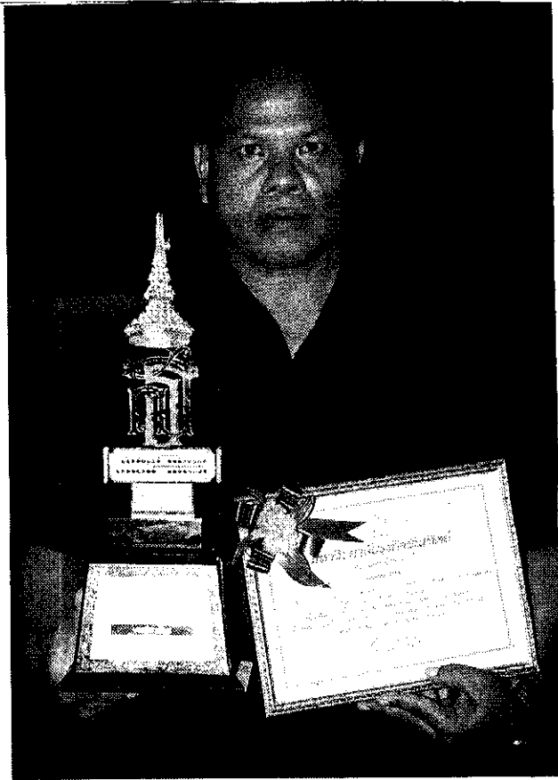
▲ ประเภทประชาชน

แต่ก็น่าเสียดายที่แทบจะไม่มีนิสิตนักศึกษา