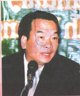
นายยงยุทธ ดิยะไพรัช รมว.กระทรวงทรัพยากรธรรมชาติและสิ่งแวดล้อม