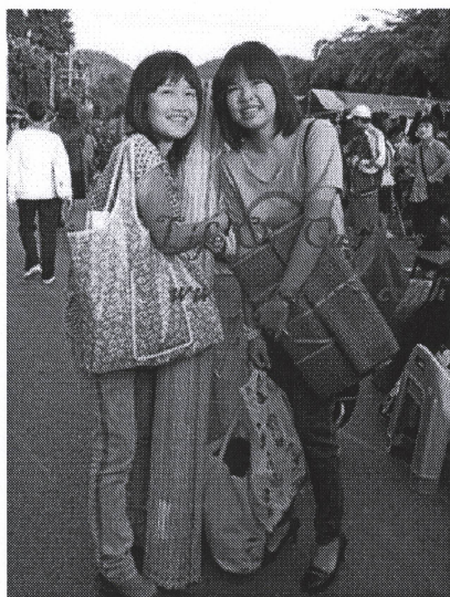
"โบว์-นุ่น" สองแม่ค้าหน้าใส จากริ้ว มฟล.เจ้าของธุรกิจเล็กๆ บนถนนคนเดิน

ถนนคนเดิน กลายเป็นแหล่งช้อปปิ้งของวัยรุ่น เพราะมีสินค้าครบวงจร ทั้งเสื้อผ้า รองเท้า กระเป๋า รวมถึงข้าวของกระจุกกระจิก ไปจนถึงขนมอร่อยๆ แบบที่เรียกว่า เดินผ่านครึ่งเดียว ก็เป็นอัน สวย - หล่อ - ลืม มีความสุขในราคาไม่แพง ซึ่งบนพื้นที่ที่ไม่เป็นทางการอย่างถนนคนเดินที่วารี ราคาตัววางแผงก็สนนราคาวันละไม่กี่สิบบาทเท่านั้น และนั่นจึงทำให้มีกลุ่มก้อนของพ่อค้าและแม่ค้าหน้าใสอยู่จำนวนมาก