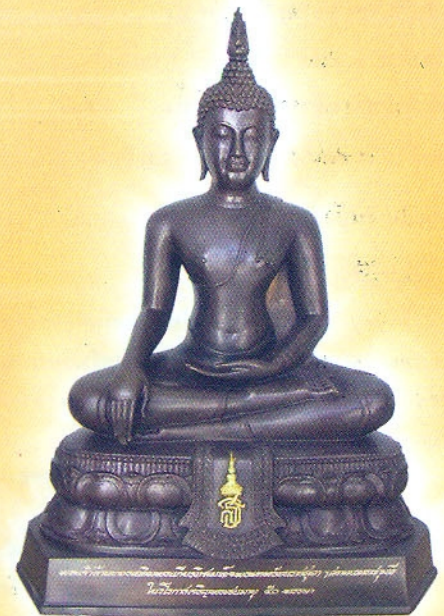
พระพุทธรูปพระเจ้าล้านทองเฉลิมพระเกียรติฯ ขนาดหน้าตัก ๙ นิ้ว