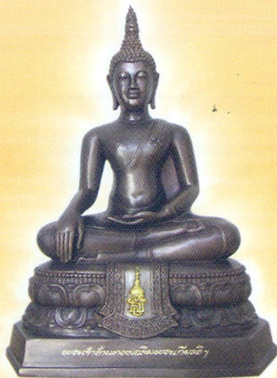
พระพุทธรูปพระเจ้าล้านทองเฉลิมพระเกียรติฯ ขนาดหน้าตัก ๕ นิ้ว