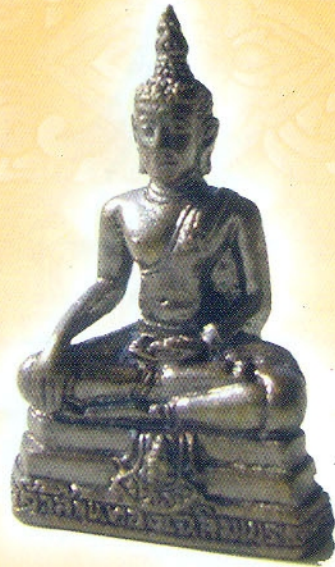
พระเจ้าล้านทองเฉลิมพระเกียรติฯ ความสูงขนาด ๓ เซนติเมตร (แบบลอยองค์)