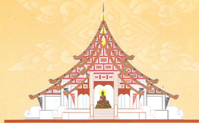
รูปจำลองวิหารพระเจ้าล้านทองเฉลิมพระเกียรติฯ (ด้านหน้า)