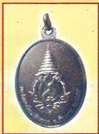
เหรียญพระเจ้าล้านทองเฉลิมพระเกียรติฯ ความสูงขนาด ๓ เซนติเมตร