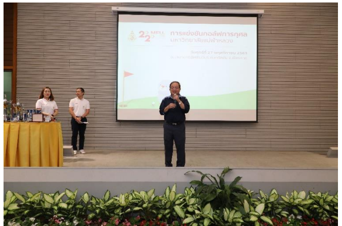
การแข่งขันกอล์ฟการกุศลมหาวิทยาลัยแม่ฟ้าหลวง เมื่อวันศุกร์ที่ 27 พฤศจิกายน 2563 ณ สนามกอล์ฟสันติบุรี คันทรี่คลับ จังหวัดเชียงราย