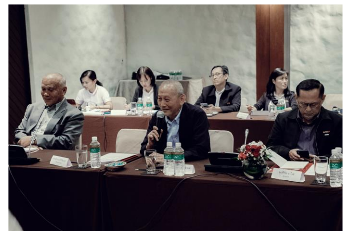
การประชุมสภามหาวิทยาลัยแม่ฟ้าหลวง วาระพิเศษ ครั้งที่ 1/2563 เมื่อวันที่ 16 - 18 ตุลาคม 2563 ณ อัดดาเลคไซด์ รีสอร์ท เขาใหญ่ จังหวัดนครราชสีมา