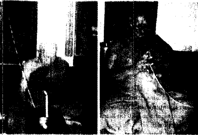
หลวงปู่ทิม และหลวงพ่อลำไย ร่วมปลุกเสก

นอกจากนี้ ยังได้สร้างพระผง "พระพุทธรูปเมตตาประทานพร" ขึ้นจำนวน 21,100