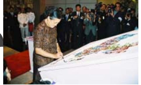
สมเด็จพระเทพรัตนราชสุดาฯ สยามบรมราชกุมารี เสด็จทรงเป็นประธานเปิดนิทรรศการ “จีนประพาส สยามบรมราชกุมารี”