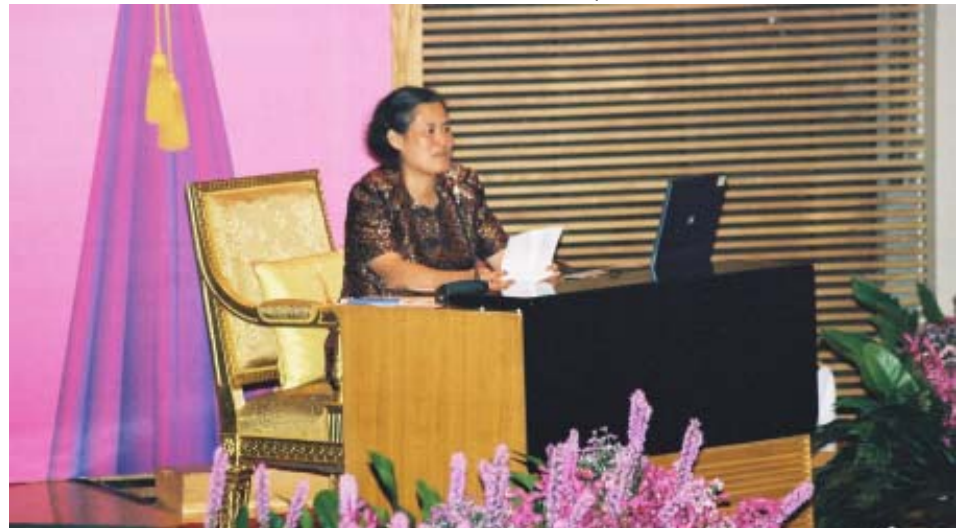
สมเด็จพระเทพรัตนราชสุดาฯ สยามบรมราชกุมารี ทรงมีพระราชดำรัสเปิดการสัมมนาในวาระนี้