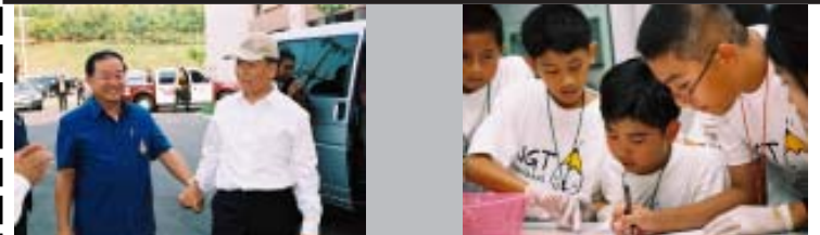
(ซ้าย) นายยงยุทธ ดิยะไพรัช รมต.ว่าการกระทรวงทรัพยากรธรรมชาติและสิ่งแวดล้อม เข้าเยี่ยมค่ายเด็กหัวแหลม (ขวา) เยาวชนที่เข้าร่วมค่ายเด็กหัวแหลม

เปิดโครงการแล้วกับค่ายบ่มเพาะวิสาหกิจสำหรับนักเรียนรุ่น “เก้าแก่น้อย” โดย หน่วยบ่มเพาะวิสาหกิจ มหาวิทยาลัยแม่ฟ้าหลวง (MFUBI) เมื่อวันที่ 1 เมษายน 2548 งานนี้จัดขึ้นเพื่อเตรียมความพร้อม ให้กับนักศึกษาที่มีความสนใจเป็นผู้ประกอบการรุ่นใหม่ ซึ่งได้รับความสนใจจากนักศึกษาหลายสถาบันที่เข้าร่วมกว่า 90 คน โดยโครงการนี้ จัดขึ้นระหว่างวันที่ 1-2 เมษายน 2548 ซึ่งนับได้ว่าเป็นโครงการที่มีประโยชน์กับนักศึกษารุ่นใหม่ที่ควรได้รับการสนับสนุนอย่างต่อเนื่อง