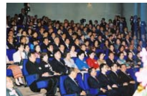
แขกผู้มีเกียรติ ตลอดจนผู้เข้าร่วมสัมมนาต่างให้ความสนใจในหัวข้อการบรรยายอย่างยิ่ง

วิทยาศาสตร์ธรรมชาติ มีห้องเกี่ยวกับธรรมชาติ เก็บของที่พระนารายณ์มหาพรทรวงส่งไปให้พระเจ้าหลุยส์ที่ 14 แห่งฝรั่งเศส แต่ก็ได้เป็นของไทยเป็นของจีน จนกระทั่งได้มีการดำเนินการทูตระหว่างไทยกับจีนวันที่ 1 กรกฎาคม 2518 สถาปนาความสัมพันธ์กันสมัยนั้น เปลี่ยนแปลงภาพความสัมพันธ์ของประเทศทั้งสอง คนที่อยู่คนละฟากฝั่งได้มาอยู่ฝ่ายเดียวกันแล้ว ทั้งสองประเทศไปมาหาสู่กันได้เป็นอย่างดี