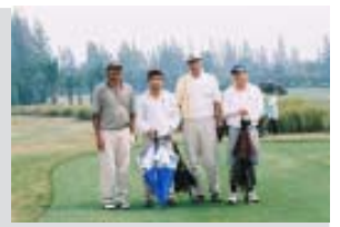
นักกอล์ฟทุกท่านต่างมุ่งมั่นหวังสิ่งเดียวกัน นั่นคือร่างกายแข็งแรง จิตใจผ่อนคลาย และได้ทำบุญ

เมื่อวันที่ 25 มีนาคม 2548 ที่ผ่านมา มหาวิทยาลัยแม่ฟ้าหลวง ได้จัดการแข่งขันกอล์ฟการกุศล ณ สนามกอล์ฟเดอะวินเทจคลับ จ.สมุทรปราการ มีผู้เข้าร่วมแข่งขันเป็นจำนวนมาก ทำให้บรรยากาศการแข่งขันเป็นไปอย่างสนุกสนาน และสรุปผลการแข่งขันได้ดังนี้