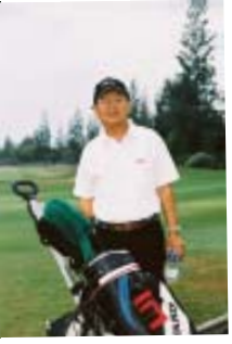
ลีลานักหวด ของผู้บริหารมหาวิทยาลัยแม่ฟ้าหลวง นำทีมโดยอธิการบดี รองอธิการบดีฝ่ายวิชาการ รองอธิการบดีฝ่ายปฏิบัติการ และคณบดีสำนักวิชาศิลปศาสตร์