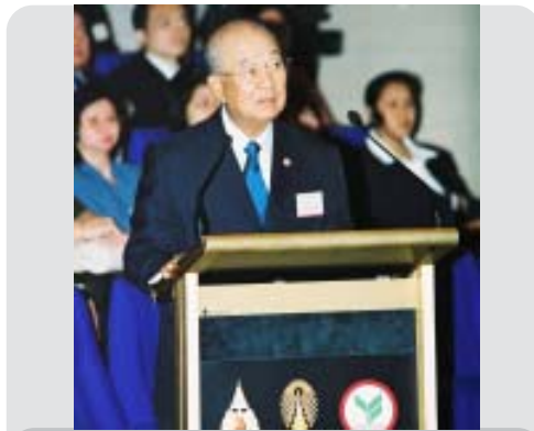
พลตำรวจเอก เกอ สารสิน นายกสภามหาวิทยาลัยแม่ฟ้าหลวง ประธานที่ปรึกษาโครงการสัมมนาในครั้งนี้ กราบบังคมทูลรายงาน

เห็นคนจีนจากแผ่นดินใหญ่ ครั้งแรกในชีวิตที่กำลังเดินๆ กันอยู่ขณะนั้นไทยเตรียมสถาปนาทางการทูตกับจีน แต่อังกฤษมีสัมพันธกับจีนมานานแล้ว และได้เดินทางไปร้านหนังสือซื้อหนังสือเกี่ยวกับจีนและเก็บรักษาไว้อย่างดี ตอนนั้นสนใจเครื่องถ้วยจีนอยู่ เพราะในพระบรมหาราชวังมีอยู่มาก เพราะของจีนถือว่ามีความสำคัญ ตอนไปฝรั่งเศสมีพิธีอภิเษก