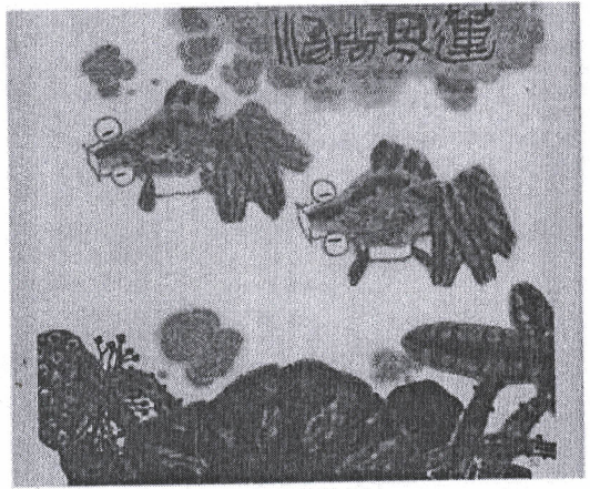
♣ ปลาหมายถึงความบริสุทธิ์

อาจารย์ ป๋อ ยี่ กั๋ว ว่า ภาพวาดฟูกันจิน ไม่เหมือนจริงนะ แต่รู้ว่าภาพนั้นเป็นอะไร เป็นนก เป็นดอกไม้ จากรูปทรงเป็นส่วนหนึ่ง แต่รู้ชัดเจน ด้วยความรู้สึก