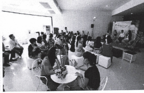
บรรยากาศภายในงาน