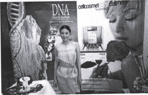
นพณีย์กับนวัตกรรม DNA