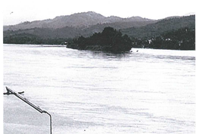
อำเภอเชียงของ เขตประกอบอุตสาหกรรม นิคมอุตสาหกรรม เพื่อการเกษตรครบวงจร และเขตอุตสาหกรรมทั่วไป ซึ่งจะดำเนินการในระยะที่ 2