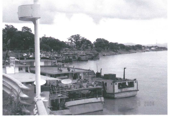
อำเภอเชียงแสน เน้นการพัฒนาเขตการลงทุนด้านอุตสาหกรรม โดยเป็นฐานการผลิต และการลงทุนที่สามารถพัฒนาเชื่อมโยงกับประเทศเพื่อนบ้านได้ โดยมีนโยบายสร้างท่าเทียบเรือขนาดใหญ่ การติดตั้งเครนสำหรับยกตู้คอนเทนเนอร์จากเรือ