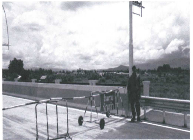
อำเภอแม่สาย พัฒนารองรับการค้า บริการ ท่องเที่ยวและศูนย์รวบรวมและกระจายสินค้า สร้างสะพานข้ามแม่น้ำสายแห่งที่ 2 เพื่อความสะดวกในการขนส่งข้ามแดน โดยมีศูนย์บริการเบ็ดเสร็จในพื้นที่ใกล้เคียง เพื่ออำนวยความสะดวก