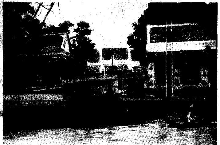
วัดดอนงคารามสมัยรัชกาลที่ 5 ด้านหน้าวัดคือคลองสมเด็จหรือคลองวัดดอนงคารามซึ่งอยู่ใกล้เคียงกับนิवासสถานเดิม

"เมื่อจำความได้ แม่ก็อยู่ที่นนทบุรีแล้ว ที่ซอยซึ่งปัจจุบันเป็นซอยวัดอนงค์ "บ้าน" นั้นเหมือนห้องแถวชั้นเดียว... ข้างหน้าบ้านมีระเบียง พื้นเป็นไม้