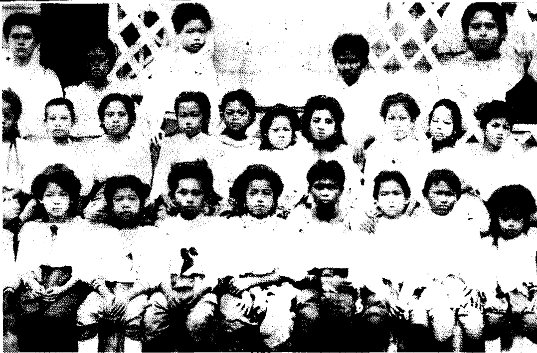
ทรงฉายพระฉายาลักษณ์ร่วมกับพระสหายโรงเรียนสตรีวิทยา

ปิดข้างๆ และมีหลังคามุงจาก ส่วนนอกก่อนถึงถนนเป็นอิฐ แล้วจึงเป็นถนน เมื่อเข้าไปในบ้านแล้วจะมีห้องโล่งๆ ด้านขวามียกพื้นซึ่งเป็นห้องพระและห้องประกอบอาชีพของพ่อแม่... ถัดไปมีห้องซึ่งเป็นห้องนอนและข้างหลังจะมีห้องครัว ยาวตลอดซึ่งกันด้วยกำแพง หลังกำแพงนี้มีที่โล่งๆ ซึ่งจะไปถึงได้ถ้าอ้อมไปเพราะทางครัวไม่มีประตูออก ในบ้านไม่มีห้องน้ำ การอาบน้ำนั้นอาบกันที่หน้าบ้าน ตุ่มน้ำตั้งอยู่ที่ระเบียงหรือไปอาบที่คลองสมเด็จเจ้าพระยา"