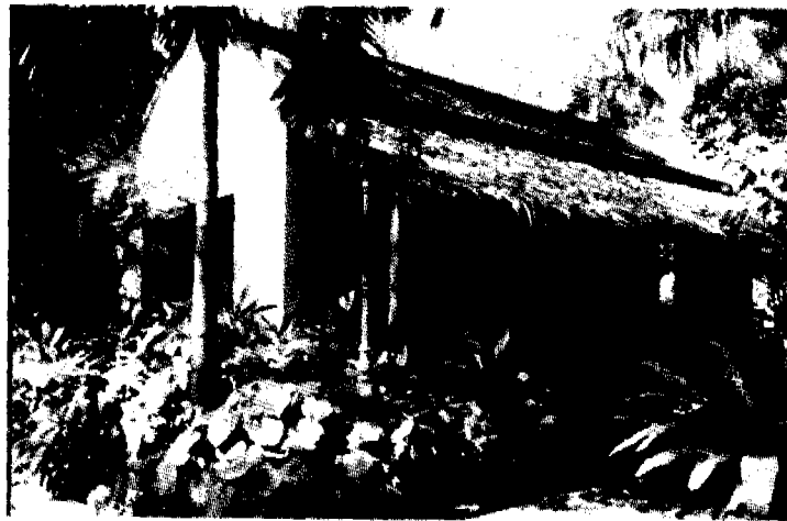
เรือนจำลองสภาพที่ประทุนเดิมในอุทยานเฉลิมพระเกียรติสมเด็จพระศรีนครินทร์บรมราชชนนี ในบริเวณ "นิวาสสถาน" เดิมใกล้วัดดอนคาราม

โดยภายในงานจะมีกิจกรรมมอบบรมสาทิสถานอาชีพและศิลปหัตถกรรม รวมถึงนิทรรศการจำลอง บ้านเดิมสมเด็จพระเจ้า เมื่อครั้งยังคงพระเยาว์ และภาพยนตร์ ส่วนพระองค์ซึ่งหาชมได้ยากนักทั้งนี้เพื่อเป็นการรำลึกว่าครั้งหนึ่งนิวาสสถานในย่านวัดดอนคารามแห่งนี้เคยเป็นที่พำนักของสตรีสามัญที่มีนามว่า "สังวาลย์" และต่อมาสตรีผู้นี้ก็ได้รับการจารึกพระนามให้เป็นปูชนียบุคคลของโลก ซึ่งเป็นที่ประจักษ์แก่ปวงชนชาวไทยและเป็นที่ยอมรับของคนทั่วโลก ○