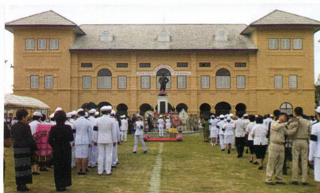
ร่วมวางพวงมาลาหน้าอนุสาวรีย์รัชกาลที่ 5 เนื่องในวัน "ปิยมหาราช"