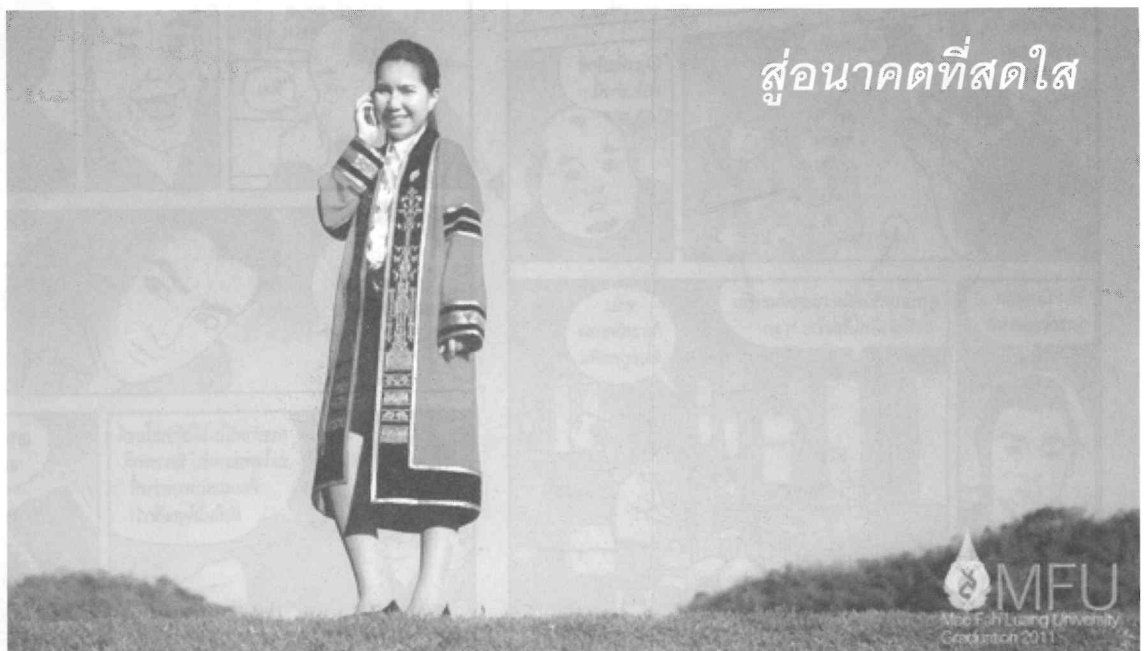
สู่ออนาคตที่สดใส

ทุกคนตั้งปณิธานจะสืบสานพระราช ปณิธานสมเด็จพระย่า “ปลูกป่า สร้างคน” สืบไป