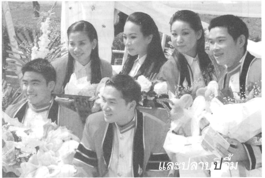
และปลาบปลื้ม