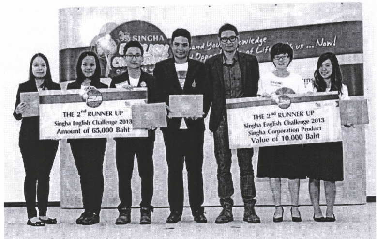
รองชนะเลิศอันดับ 2 (รับร่วม 2 ทีม) 1.ทีม FMS 2 และ 2.ทีม Margaret