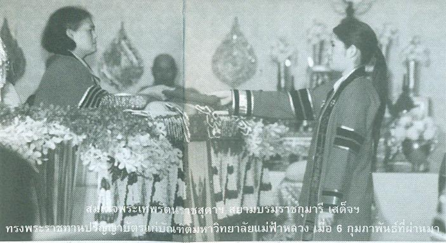
สมเด็จพระเทพรัตนราชสุดาฯ สยามบรมราชกุมารี เสด็จฯ ทรงพระราชทานปริญญาบัตรแก่นักบัณฑิตมหาวิทยาลัยแม่ฟ้าหลวง เมื่อ 6 กุมภาพันธ์ที่ผ่านมา