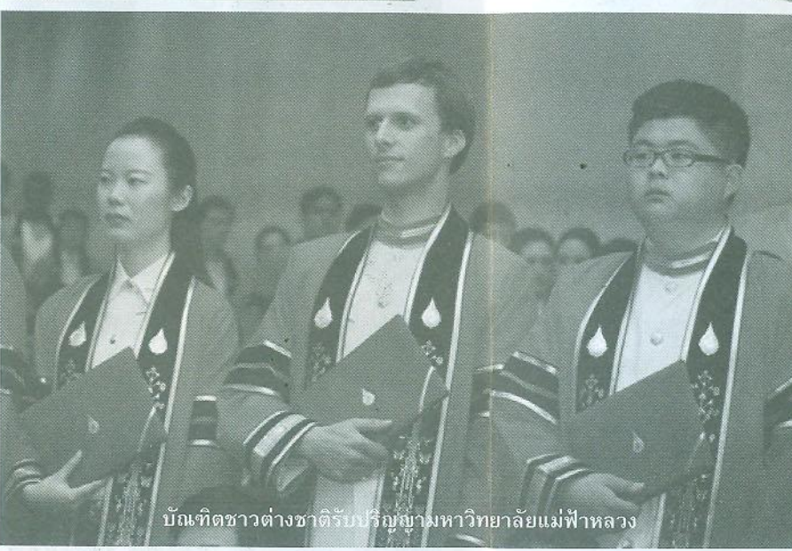
บัณฑิตชาวต่างชาติได้รับปริญญาามมหาวิทยาลัยแม่ฟ้าหลวง

ศาสนาอย่างไร เมื่อมีคานาโนตั้งอยู่ฝั่งตรงข้ามแม่น้ำโขง ทั้งนี้ทุกภาคส่วนของเชียงรายต้องตอบคำถามร่วมกันว่าจุดเด่นของเชียงรายคืออะไร ยุทธศาสตร์ของเชียงรายเป็นอย่างไรในทุกๆ ด้าน โดยเฉพาะด้านการศึกษา จะเตรียมกำลังคนอย่างไร เพื่อรับความเปลี่ยนแปลง