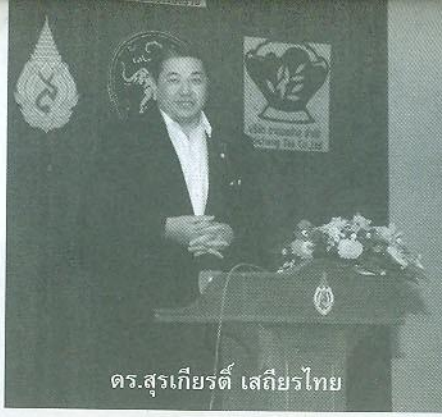
ดร.สุรเกียรติ์ เสถียรไทย

ดร.สุรเกียรติ์ เสถียรไทย อธิการ นายกรัฐมนตรี กล่าวว่า เชียงรายมีโอกาส ที่จะเป็ศูนย์กลางต่าง ๆ ของภูมิภาคนี้ เช่น การคมนาคม การท่องเที่ยว อุตสาห กรรม การเกษตร การค้า ด้านสุขภาพ ด้าน ศาสนา เป็นต้น ซึ่งเป็นสิ่งที่ท้าทายอนาคต ของเชียงรายว่าจะเป็ศูนย์กลางต่างๆ นี้ได้ อย่างไร ไม่ว่าจะเป็นศูนย์กลางการท่องเที่ยวเชิง วัฒนธรรมไปพร้อมกับการเป็ศูนย์กลางอุต สากรรมได้อย่างไร จะเป็ศูนย์กลางด้าน