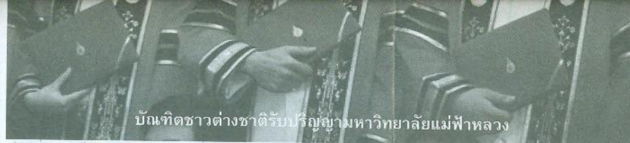
บัณฑิตชาวต่างชาติได้รับปริญญา มหาวิทยาลัยแม่ฟ้าหลวง

ด้านพระมหาวุฒิชัย วชิรเมธี กล่าว ถึงข้อกังวลต่ออนาคตของเชียงรายในหลาย ประเด็น โดยเฉพาะเรื่องผลกระทบด้านสิ่งแวดล้อมและทรัพยากรธรรมชาติ หากมีการ สร้างนิคมอุตสาหกรรมในจังหวัดเชียงราย หรือการก่อสร้างตึกสูงหรือโครงการขนาดใหญ่ ควรมีการสอบถามความคิดเห็นจาก หลายฝ่าย และต้องไม่ทำให้เสียภูมิทัศน์ ควร จะมีการจัดทำแผนแม่บททั้งระยะสั้นและระยะ ยาว ถึงทิศทางการพัฒนาเชียงราย นอกจากนี้ ยังมีความจำเป็นต้องเตรียมความพร้อมคน เพื่อรับการเปลี่ยนแปลง เมื่อมีการเคลื่อนย้าย คนหรือแรงงานได้เสรี จำเป็นต้องเตรียมคน ของเราเองให้พร้อมสำหรับการอยู่ร่วมกับคน ต่างถิ่นไม่เฉพาะเรื่องภาษาเท่านั้น แต่รวมถึง เรื่องสังคมวัฒนธรรม พร้อมกันนี้ยังได้เรียกร ้องให้คนเชียงรายให้ความสนใจและ ต้องเข้าไปมีส่วนร่วมที่จะกำหนดทิศทาง ของการเปลี่ยนแปลงที่จะเกิดขึ้นนี้ด้วย