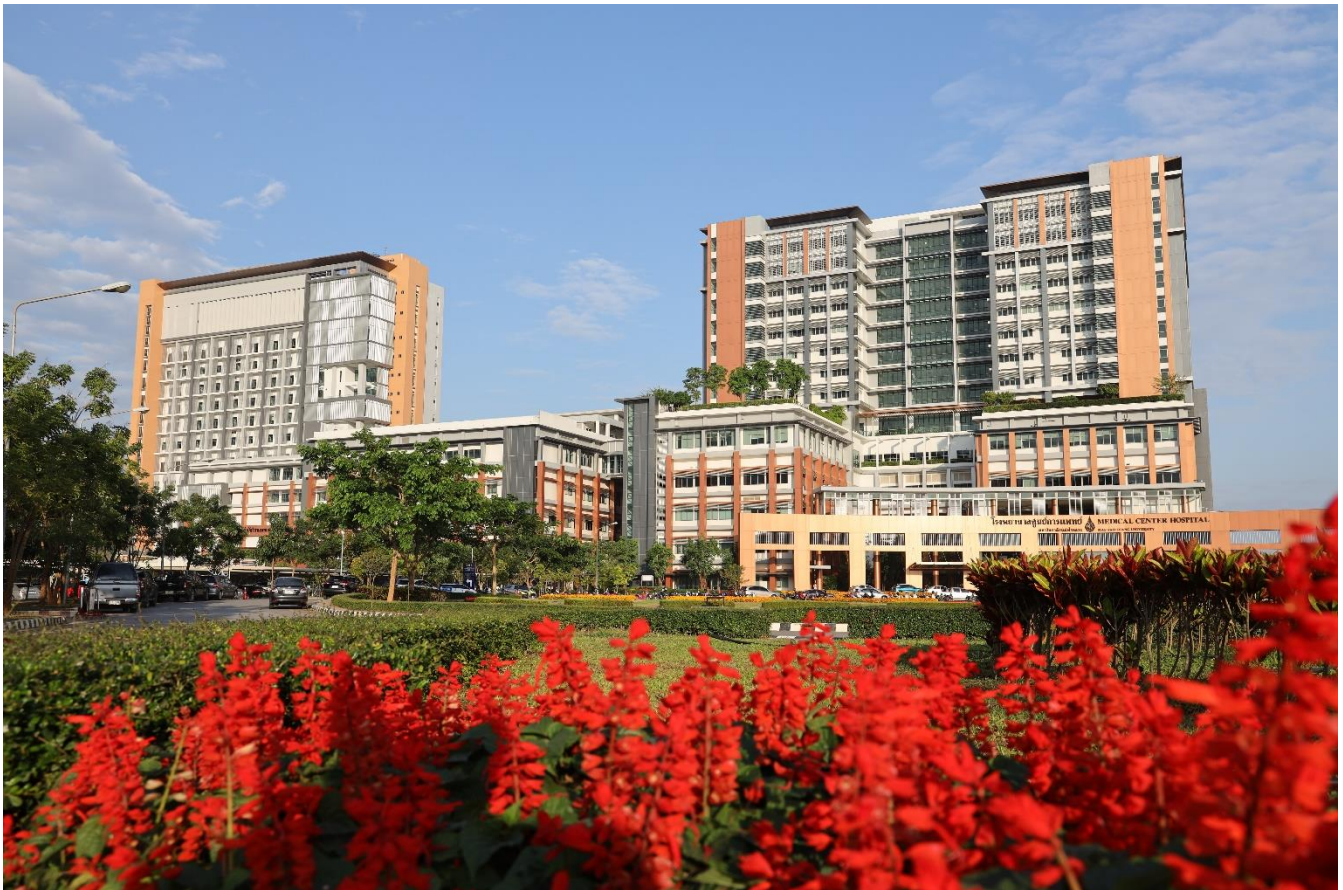
โรงพยาบาลศูนย์การแพทย์มหาวิทยาลัยแม่ฟ้าหลวง

ปีที่ 7 ฉบับที่ 4 เดือน ธันวาคม พ.ศ. 2565